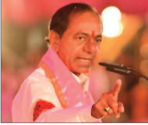
మొదటి వీట్ తరువాలు

హైదరాబాద్, జనవరి 31: శంషాబాద్ విమానాశ్రయంలో డీఆర్ఐ అధికారులు శనివారం మధ్యాహ్నం భారీగా విదేశీ డ్రగ్స్ ను స్వాధీనం చేసుకున్నారు. బ్యాంకాక్ నుంచి వచ్చిన ప్రయాణికుడు బ్యాగులను తనివీటి చేసిన అధికారులు వారి వద్ద నుంచి రూ. 9.5 కోట్ల విలువైన 27 కిలోల హైడ్రోఫోనిక్ గంజాయిని స్వాధీనం చేసుకున్నారు. ట్రాలీ బ్యాగుల్లో ఉంచి తరలిస్తుండగా పట్టుకున్నారు. నలుగురు విదేశాల నుంచి వచ్చిన నలుగురితో పాటు గంజాయిని తీసుకు వెళ్లేందుకు వచ్చిన మరో ముగ్గురిని డీఆర్ఐ అధికారులు అరెస్టు చేశారు. వీరిపై కేసు నమోదు చేసుకుని దర్యాప్తు చేస్తున్నారు.