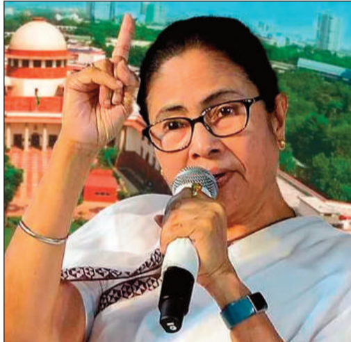
వినిపించిన సీఎం మమతా బెనర్జీ.. ఎన్నికల సంఘాన్ని 'హల్టావ్ కమిషన్'గా అభివర్ణించారు. ఎన్ఐఆర్ ప్రక్రియ