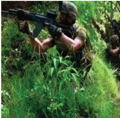
స్వాధీనం చేసుకున్నాయి. మరికొందరు ఉగ్రవాదులు దాక్కున్నారా? అనే అనుమానంతో గాలింప చర్చలను ముమ్మరం చేశాయి. జైష్-ఎ-మొహమ్మద్ గతంలో కూడా

స్పెషల్ ఆపరేషన్ తో ఖతం జమ్ము ఉదంపూర్ లో ఎన్ కౌంటర్ కశ్మీర్: జమ్ము కశ్మీర్ లోని ఉదంపూర్ జిల్లాలో భద్రతా దళాలు బుధవారం స్పెషల్ ఆపరేషన్ తో ఉగ్రవాదుల్ని మట్టుబెట్టాయి. జైష్-ఎ-మొహమ్మద్ కు చెందిన ఇద్దరు ఉగ్రవాదులు ఓ గుహలో తలదాచుకోవడం తీవ్ర కలకలం రేపింది. అయితే పక్కా సమాచారం అందుకున్న బలగాలు ఎన్ కౌంటర్ లో వాళ్లను హతమార్చి ఆపరేషన్ పూర్తి చేశాయి. భద్రతా దళాలు ప్రాంతాన్ని పూర్తిగా మట్టుడి చేసి, స్థానిక ప్రజలకు ఎలాంటి ప్రమాదం కలగకుండా జాగ్రత్తలు తీసుకున్నాయి. ఉగ్రవాదులు గుహలో దాక్కుపోవడంతో.. ఆపరేషన్ క్లిష్టంగా మారింది. స్పెషల్ పూహాత్మకంగా ముందుకు సాగి వారిని అంతం చేసింది. ఈ ఆపరేషన్ లో.. గుహ నుంచి రైఫిళ్లు, పేలుడు పదార్థాలు, ఇతర ఆయుధాలను భద్రతా బలగాలు