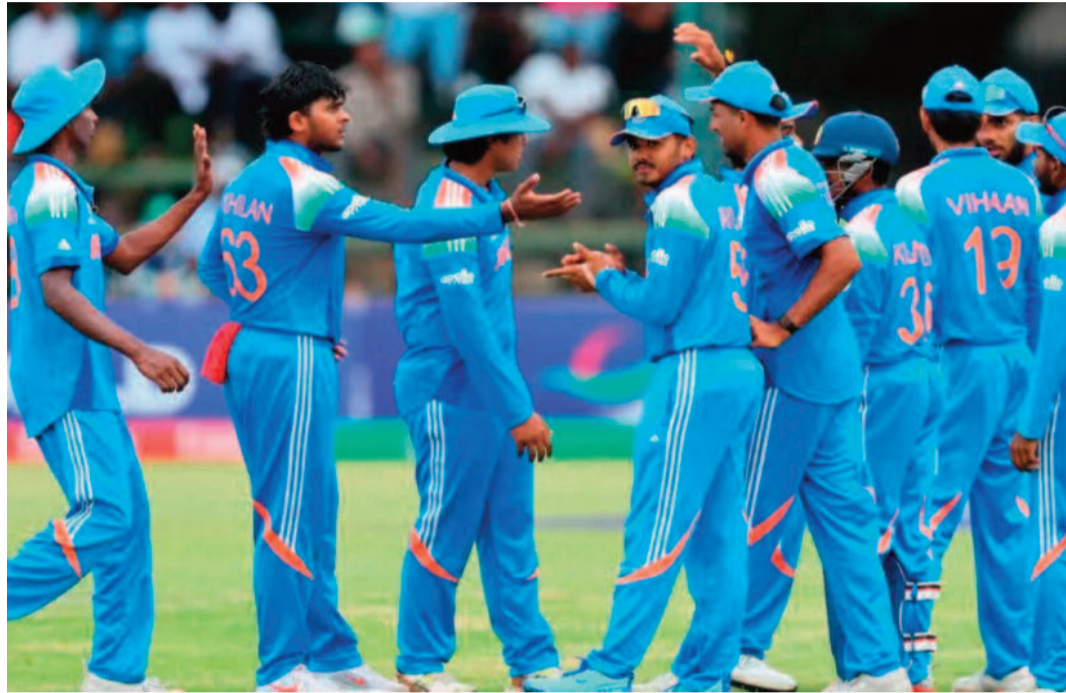
బలాన్ని స్పష్టంగా చూపిస్తోంది.

అండర్-19 వరల్డ్ కప్ లో భారత్ విజయం శాతం 92.1 శాతంగా ఉంది. వరల్డ్ కప్ చరిత్రలో ఇది గొప్ప రికార్డుల్లో ఒకటి. మొత్తంగా చూస్తే.. 2016 నుంచి అండర్-19 వరల్డ్ కప్ లో భారత్ యువ జట్టు ఆధిపత్యం