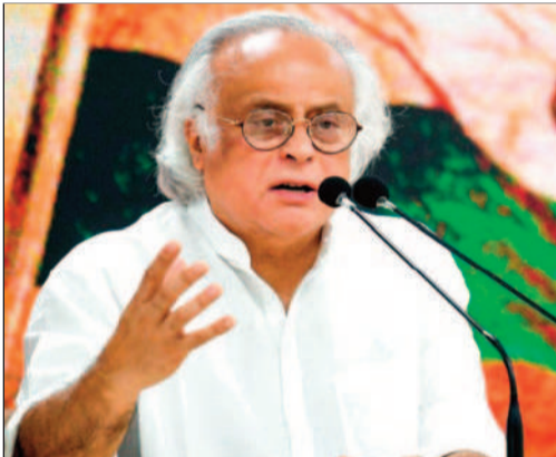
కొగిలింతలు, దిగిన ఫోటోలు పెద్దగా ఫలింపలేదు. నమస్తే ట్రంప్.. మోదీ మోడీపై స్కోర్ చేసింది. స్నేహితుడు ఇకపై స్నేహితుడు కాదు అని జైరామ్ రమేష్ అన్నారు.

చమురు కొనుగోలు చేస్తే 25 శాతం జరిమానాను భారత్పై తిరిగి విధించిన అమెరికా ప్రకటించింది' అని రమేష్ ఎక్స్ పోజీతో పేర్కొన్నారు. ఈ సందర్భంగా ప్రధాని మోదీని ఆయన విమర్శించారు. 'ట్రంప్తో మోదీ దిగిని ఫోటోలను ప్రస్తావిస్తూ.. 'ఫోటో ఆఫ్ భారతదేశానికి పెద్దగా ప్రయోజనం చేకూర్చలేదని, దౌత్య వైఫల్యాన్ని సూచిస్తున్నాయని ఆయన అన్నారు. భారతీయ రైతులను బణంగా పెట్టి అమెరికన్ రైతులకు సహాయం చేయడానికి భారతదేశం దిగుమతి సుంకాలను తగ్గిస్తుంది. ఈ ఒప్పందంతో అమెరికా నుండి భారత్ వారికి దిగుమతులు మూడురెట్లు పెరుగుతాయి. మన దీర్ఘకాల వస్తువుల వాణిజ్య మిగులు తుడిచిపెట్టుకుపోతుంది. భారత్ నుంచి అమెరికాకు ఐటీ, ఇతర సేవల ఎగుమతులపై తీవ్ర అనిశ్చితి కొనసాగుతుంది. అలాగే అమెరికా ఎగుమతులు చేసే భారత్ వస్తువులపై గతకంటే ఎక్కువ సుంకాలు విధిస్తారు. దీన్నిబట్టి చూస్తే.. ట్రంప్ను చేసుకున్న