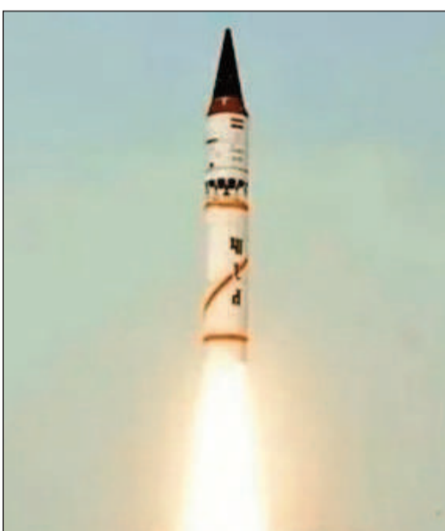
చేయగల సత్తా భారత్ సొంతమైందని రక్షణ రంగ విశ్లేషకులు చెబుతున్నారు.

అగ్ని-1 క్షిపణి 700 కిలోమీటర్ల దూరంలోని లక్ష్యాలను చేదించగలదు. దీనిని 220 కిలోమీటర్ల తక్కువ దూరంలోని లక్ష్యాలను ధ్వంసం చేయడానికి కూడా వినియోగించవచ్చని డీఆర్డీఓ వర్గాలు తెలిపాయి. అగ్ని-2 క్షిపణి 2 వేల కిలోమీటర్ల పరిధిని కలిగి ఉంది. తాజాగా పరీక్షించిన అగ్ని-3 క్షిపణి 3 వేల కిలోమీటర్ల దూరంలోని శత్రు సౌకరాలను బాదిం చేయగలదు. అగ్ని-4 క్షిపణి 4 వేల కిలోమీటర్ల దూరంలోని లక్ష్యాలను తాకగలదు. ఇక అగ్ని-5 అత్యధికంగా 5 వేల కిలోమీటర్ల పరిధిని కలిగి ఉంది, ఖండాంతర క్షిపణిగా దేశానికి రక్షణ కవచంగా నిలుస్తోంది.