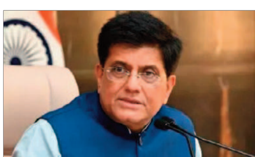
పైబిలుకు జీసీసీలు ఉన్నాయని అన్నారు. వీటితో ఉద్యోగాలు, ప్రభుత్వానికి పన్ను ఆదాయం లభిస్తోందని అన్నారు. ఉద్యోగులు తమ కుటుంబాలకు దగ్గరగా ఉండగలుగు తున్నారని అన్నారు. గ్లోబల్ సంస్థల లాభదాయకత కూడా పెరుగుతోందని చెప్పారు.

లు స్వల్ప సంఖ్యలో ఉన్న వీసాల కోసం అధికంగా దరఖాస్తులను సమర్పించాల్సిన పరిస్థితి వచ్చిందని అన్నారు. కొవిడ్ తరువాత ప్రపంచం ఎంతో మారిపోయిందని, నాటి రోజులు ఎప్పుడో పోయాయని వ్యాఖ్యానించారు. హెచ్-1బి వీసా అంశంపై అమెరికాతో చర్చించాలని తనను ఏ కంపెనీ కోరనా సంక్షోభం తరువాత అభ్యర్థించ లేదని మంత్రి తెలిపారు. ఒకప్పుడు అమెరికాలో ఆన్లైన్ టోల్ చేసిన పనిని భారత్ నుంచి రిమోట్గా చేయవచ్చని విషయాన్ని కంపెనీలు గుర్తించాయని అన్నారు. అమెరికాలో హెచ్-1బి వీసా ఉద్యోగులకు సంస్థలు భారీగా జీతాలు చెల్లించాల్సి వచ్చేదని కూడా అన్నారు. గ్లోబల్ కేవలబిటి సెంటర్లకు (జీసీసీ) పనులు ఔట్సోర్సింగ్తో అటు కంపెనీలకు ఇటు భారత ఆర్థిక వ్యవస్థకు లాభం కలుగుతుందని చెప్పారు. భారత్లో ప్రస్తుతం 1800