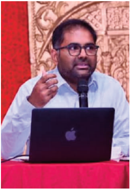
ఎఫ్.ఎల్.ఎన్ కార్యక్రమం అమలు చేస్తున్నామని అన్నారు. జిల్లాలో మిడ్ లైన్ పరీక్షా ఫలితాలతో పిల్లలు చదువుతున్నప్పటికీ చదివింది అర్థం చేసుకోవడంలో కొంత వెనుకబడి ఉన్నట్లు గమనించామని, పిల్లలకు

చదివింది అర్థమయ్యే గ్రహణ శక్తి అందేలా చర్యలు తీసుకోవాలని కలెక్టర్ ఉపాధ్యాయులకు సూచించారు. ప్రభుత్వ పాఠశాలల్లో ప్రతి రోజూ ప్రత్యేకంగా రీడింగ్ కోసం సమయం కేటాయించినప్పటికీ కొంత వెనుకబడి ఉన్నామని, ప్రత్యామ్నాయ ప్రణాళికలు అమలు చేస్తూ మెరుగైన ఫలితాల సాధనకు కృషి చేయాలని కలెక్టర్ సూచించారు. ప్రభుత్వ పాఠశాలల్లో చదివే ప్రాథమిక విద్యార్థుల సరైన విద్యా ప్రమాణాలు ఉన్న విద్యార్థుల సంఖ్య చాలా తక్కువగా ఉందని, ఇది చాలా ఆందోళనకర పరిస్థితులను సూచించింది కలెక్టర్ తెలిపారు. ఒకటిన్నర నెల తర్వాత జరిగే తుది పరీక్షల్లో విద్యార్థుల విద్యా ప్రమాణాల వివరాలను సరిగ్గా నమోదు చేయాలని అన్నారు. మనం ఎక్కడ వెనుకబడి ఉన్నామో గమనించి అక్కడ మన పిల్లలు ఇంప్రోవ్ అయ్యేలా ప్రత్యేక శ్రద్ధ తీసుకోవాలని అన్నారు. పాఠశాల తరగతి గదిలో ఉన్న విద్యార్థులలో కనీసం 80 శాతం పిల్లలకు చదవడం, 60 శాతం రాయడం, 90 శాతం నెంబర్ ల గుర్తింపు, 80 శాతం బేసిక్ మ్యాథ్ ప్రమాణాలు అందేలా ఉపాధ్యాయులు చర్యలు