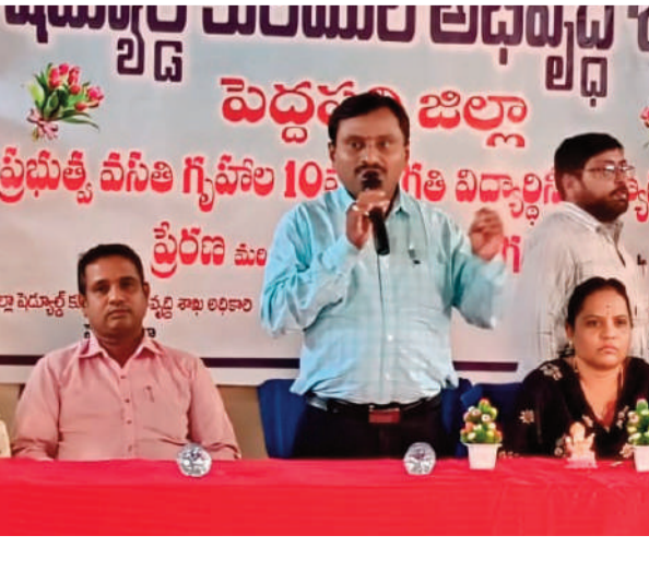
పెద్దపల్లి జిల్లా ప్రభుత్వ వసతి గృహాల పదవ తరగతి విద్యార్థులకు ప్రేరణ అవగాహన తరగతులు నిర్వహించారు.