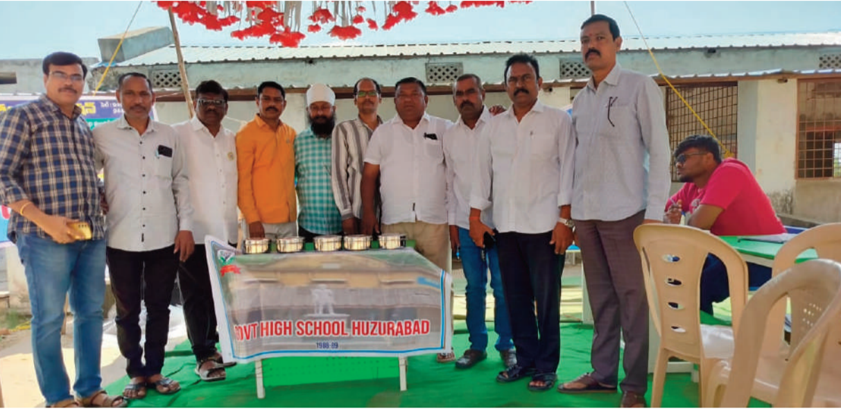
జీ స్వామి హుజూరాబాద్

1988-89 హైస్కూల్ బ్యాచ్ పూర్వ విద్యార్థుల రక్తదానం