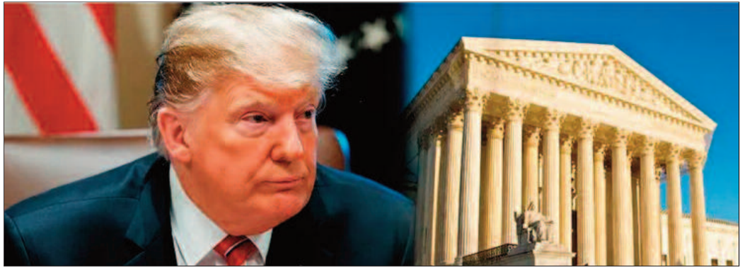
జాతీయ భద్రత పేరిట గతంలో విధించిన సుంకాలు యథాతథంగా కొనసాగుతాయని వైట్ హౌస్ వర్గాలు వెల్లడించాయి.

వాషింగ్టన్, ఫిబ్రవరి 23: అమెరికా అధ్యక్షుడు డొనాల్డ్ ట్రంప్ అత్యంత ప్రతిష్టాత్మకంగా అమలు చేస్తున్న అంతర్జాతీయ సుంకాల విధింపును క్రేక్ పడింది. ఆర్థిక ఎమర్జెన్సీ పేరిట విదేశీ వస్తువులపై విధిస్తున్న సుంకాలు చెల్లబంటూ సుప్రీంకోర్టు ఇచ్చిన తీర్మానకు తలొగ్గిన ప్రభుత్వం, మంగళవారం సుంచి వాటిని నిలిపివేస్తున్నట్లు ప్రకటించింది. ఈ మేరకు యూఎస్ కస్టమ్స్ అండ్ బోర్డర్ ప్రొటెక్షన్ (సీబీపీ) శాఖ తాజాగా ఒక ప్రకటన విడుదల చేసింది. అమెరికా కాలమానం ప్రకారం మంగళవారం ఆర్థికాది 12.01 గంటల సుంచి ఇంటర్నేషనల్ ఎమర్జెన్సీ ఎకనమిక్ పవర్స్ (ఇఈఈపీ) చట్టం కింద సుంకాల వసూళ్లను నిలిపివేస్తున్నట్లు స్పష్టం చేసింది. సుప్రీంకోర్టు తీర్మానతో పాత పద్ధతిలో సుంకాలు నిలిపివేయనిప్పటికీ, ట్రంప్ తన మొండి వైగిరిని మాత్రం వీడలేదు. గతంలో ప్రకటించిన 10 శాతం గ్రోబల్ టారిఫ్లను ఏకంగా 15 శాతానికి పెంచుతూ నిర్ణయం తీసుకున్నారు. ఇఈఈపీ చట్టం సానుండో 'వాణిజ్య చట్టం-1974'లోని సెక్షన్ 122 కింద సర్వార్థే పేరిట ఈ వసూళ్లకు తెరతీశారు. అయితే, దీనిని కూడా చట్టసభల అనుమతి లేకుండా 150 రోజులకు మించి పొడిగించే అవకాశం లేకపోవడం గమనార్హం. మరోవైపు ట్రేడ్, అల్ట్రామినియం, సెమీకండక్టర్లపై