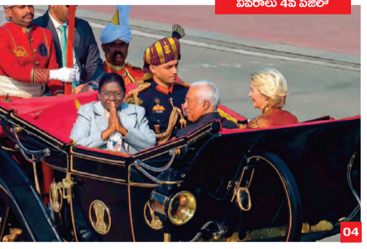
వివరాలు 4వ పేజీలో

దేశ రాజధాని దిల్లీలో గణతంత్ర వేడుకలు అంబరాన్నింటాయి. ఉదయం 10.30 గంటలకు కర్ణాటకలో రాష్ట్రపతి ద్రౌపది ముర్ము జాతీయ జెండాను ఆవిష్కరించారు. అనంతరం సైనిక దళాల కవాతు ప్రారంభమైంది. ఆపాచీతో పాటు ప్రచంద్ తేరికపాటి హెలికాప్టర్ విమానాలు ఆకట్టుకున్నాయి. పోరులో భరించే దుస్థలతో అశ్వశక్త దళం తొలిసారి ఈ పరేడ్ లో పాల్గొంది. ఇరో పా సమాఖ్యకు చెందిన సైనిక విమానం కూడా ప్రదర్శనలిచ్చింది. దేశ అభివృద్ధి ప్రస్థానం, సాంస్కృతిక వైభవం, సైనిక బలం, ఆపరేషన్ సిందూర్ లో వాడే ప్రధాన ఆయుధ వ్యవస్థలు వంటివి ప్రత్యేక ఆకర్షణగా నిలిచాయి. ఈ వేడుకలకు యూరోపియన్ కౌన్సిల్ అధ్యక్షుడు ఆంటోనియో కోస్టా, ఇరోపా కమిషన్ అధ్యక్షురాలు ఉర్సులా వాన్డెర్ లేయెన్ ముఖ్య అతిథులుగా హాజరయ్యారు.