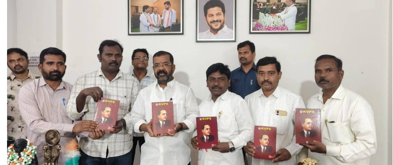
హనుమకొండ, 02 ఏప్రిల్ 2026 (జై భీమ్ న్యూస్)