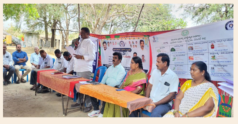
ఏప్రిల్ 02 జై భీమ్ ప్రతినది: (వరంగల్/పర్చున్నపేట)