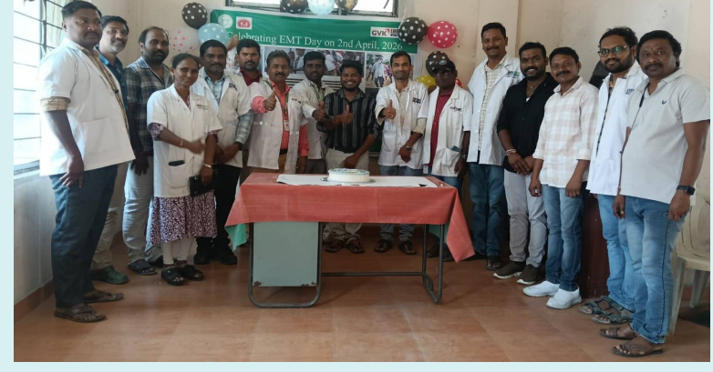
ఏప్రిల్ 02, జై భీమ్ ప్రతినది: (వరంగల్/పర్చున్నపేట)

ఆపదలో అందం 24/7 సేవలు ప్రాణరక్షకులైన 108 సిబ్బందికి ప్రజల ఘన సత్కారం