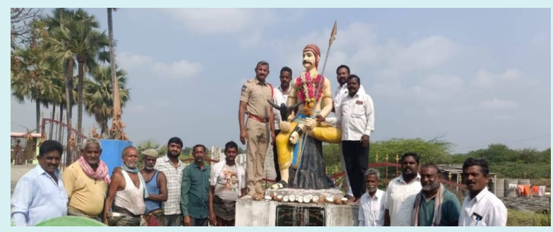
ఏప్రిల్ 02, జై భీమ్ ప్రతినది: (వరంగల్/పర్చున్నపేట)

ఇల్లందలో ఘనంగా వర్ధంతి వేడుకలు వేదల హక్కుల కోసం పోరాడిన మహావీరుడికి నివాళులు