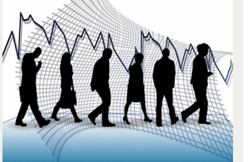
పాకిస్థాన్, జై భీమ్ న్యూస్

ఉపాధి లేక దేశం విడిచి వెళుతున్న నిపుణులు, డాక్టర్లు పైవేటు రంగం కూడా కుదేలు.. మూతపడుతున్న పరిశ్రమలు