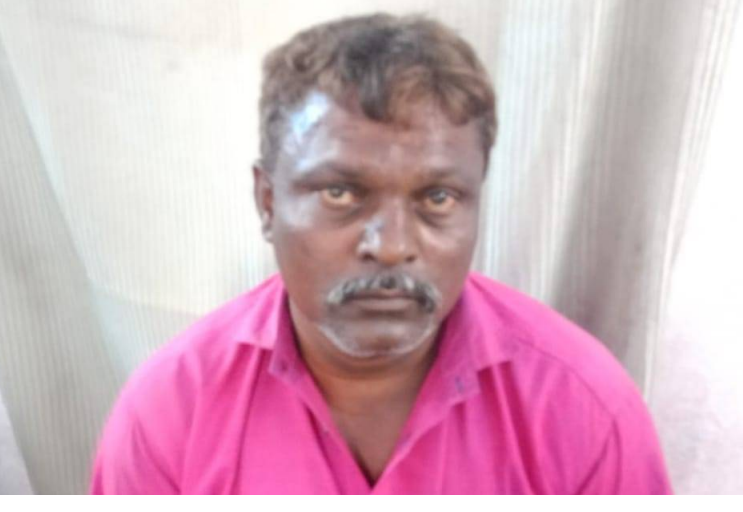
హన్మకొండ, 19 ఫిబ్రవరి 2026(జై భీమ్ న్యూస్)