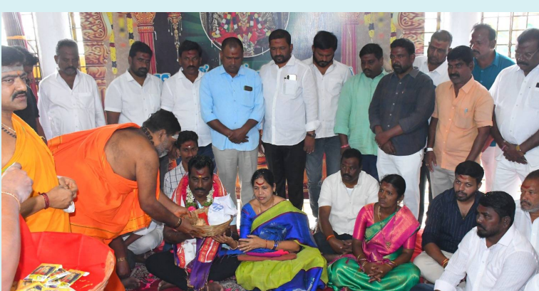
వరంగల్, ఫిబ్రవరి 10, 2026(జై భీమ్ న్యూస్)