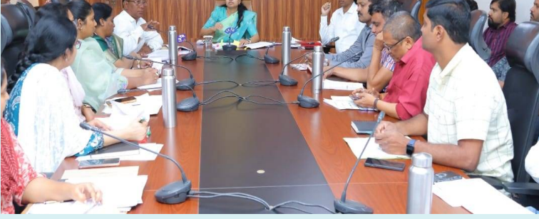
హన్మకొండ, 10 ఫిబ్రవరి 2026(జై భీమ్ న్యూస్)