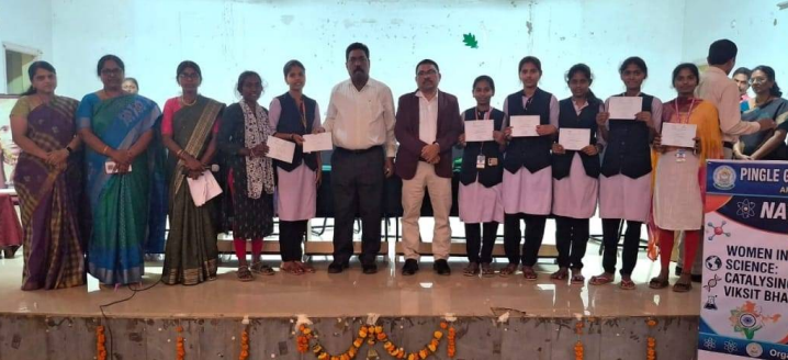
హన్మకొండ, 28 ఫిబ్రవరి 2026 (జై భీమ్ న్యూస్)