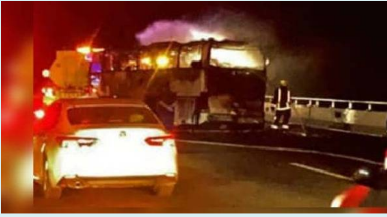
హైదరాబాద్, జై భీమ్ న్యూస్

గత ఏడాది నవంబర్లో మక్కా చెందిన 44 మంది మృతుల కుటుంబాలకు రూ.5 లక్షల పరిహారం అందజేత గాయపడిన వారికి రూ.3 లక్షల చొప్పున అందజేత