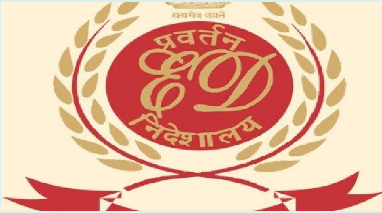
హైదరాబాద్, జై భీమ్ న్యూస్

సాయి సూర్య దేవలపర్వకు చెందిన రూ.14.63 కోట్ల ఆస్తుల అటాచ్ ప్లాట్ల పేరుతో కస్టమర్లను మోసం చేసినట్లు ఆరోపణలు కుటుంబ సభ్యులు ఖాతాలోకి భారీగా నిధుల మళ్లంపు అనుమతి లేని లేపుట్లతో ప్లాట్ల విక్రయాలు మనీలాండరింగ్ చట్టం కింద దర్యాప్తు కొనసాగిస్తున్న ఈడీ