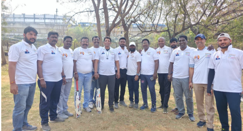
మానసిక ఒత్తిడి లభింపజేసే క్రీడలతోనే సాధ్యం. ప్రపంచం మొత్తం క్రీడలతో నిండుకుంటుంది. ప్రపంచంలో క్రీడలే ఆటకు లెక్కా స్థాయిలో అదరణ కలదు. జర్మనీలను క్రీడా జబ్బర్నా గుండ్లు ఉంది.