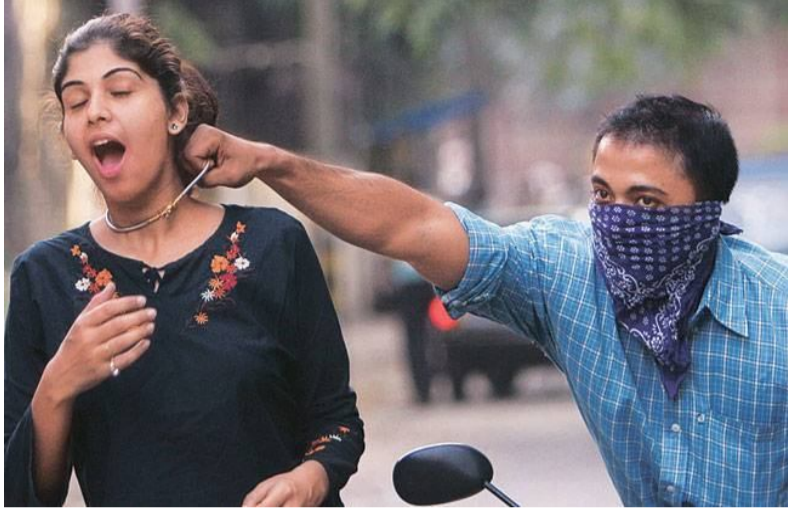
తులం లక్ష్మణ్ దాటడంతో చైనీస్ స్వాచిన్ గుండ్ల హత్యల వరకూ హైదరాబాద్ లో అంతరాష్ట్ర ముఠాల మకాం, ఒంటరి మహిళలే టార్గెట్