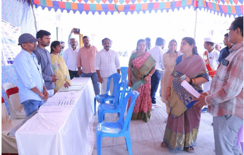
వరంగల్, 28 జనవరి 2026(జై భీష్మ న్యూస్)