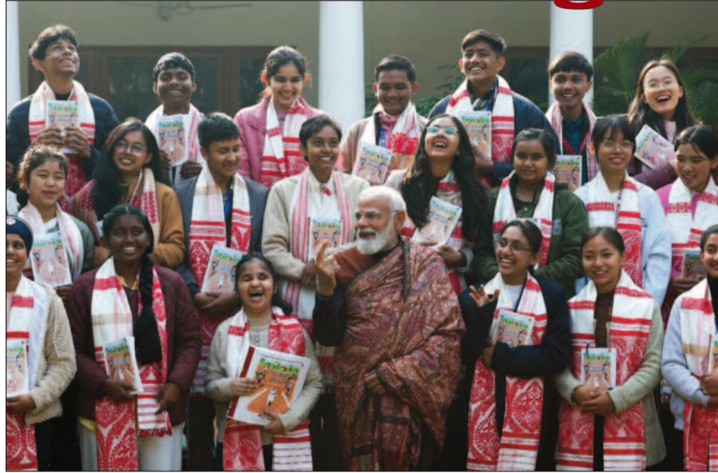
గేమ్స్ తయారు చేయాలని ప్రధాని ప్రోత్సహించారు.

న్యూఢిల్లీ : అదేపనిగా ఆన్లైన్ గేమ్లు ఆడవద్దని విద్యార్థులకు ప్రధాని సరేంద్ర మోడీ సూచించారు. శుక్రవారం పరీక్షా పే చర్చ-2026 కార్యక్రమంలో భాగంగా దేశవ్యాప్తంగా విద్యార్థులు, తల్లిదండ్రులు, ఉపాధ్యాయులతో సంభాషించారు. పాఠశాల సంవత్సరాల్లో బలమైన పునాది వేసుకోండి. అప్పుడే పోటీపరీక్షలు సులభం అవుతాయి అని సూచించారు. విషయాలను అనుసంధానం చేసుకోవడం, మనసును సిద్ధం చేసుకోవడం ముఖ్యమని తెలిపారు. కంప్యూటర్లో నుంచి బయటకు రండి, సవాళ్లను అవకాశాలుగా చూడండి అని ప్రధాని ప్రోత్సహించారు.