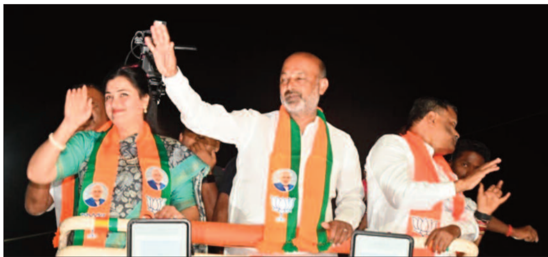
తీసుకువచ్చిన నిధులతో జరిగిన పనులను ప్రజలకు వివరించారు. ఆధ్యాత్మిక అంశాలపైనూ దృష్టి సారినూ

కరీంనగర్, జనత స్టూన్: మున్సిపల్ ఎన్నికల ప్రచారం ముగిసిన నేపథ్యంలో జిల్లాలో ప్రధాన రాజకీయ పార్టీల ప్రచార సరళి విశేషంగా కనిపించింది. ఈ క్రమంలో కేంద్ర హోంశాఖ సహాయ మంత్రి బండి సంజయ్ కుమార్ జిల్లాలోని మున్సిపాలిటీల్లో విస్తృతంగా పర్యటిస్తూ భారతీయ జనతా పార్టీ అభ్యర్థుల గెలుపు కోసం విభిన్న శైలిలో ప్రచారం నిర్వహించారు. అభివృద్ధి, ఆధ్యాత్మికం, ఆదర్శ పాలన అనే మూడు అంశాలను ప్రధానంగా ప్రస్తావిస్తూ ప్రజల్లోకి వెళ్లారు. జిల్లాలోని మున్సిపాలిటీల్లో ప్రతి డివిజన్, వార్డులో రోడ్ షోలు, కార్పర్ మీటింగులు నిర్వహిస్తూ అభ్యర్థులకు మద్దతు కోరారు. కేంద్ర ప్రభుత్వ నిధులతో చేపట్టిన అభివృద్ధి పనులు, పట్టణాల్లో మౌలిక వసతుల విస్తరణ, ప్రజా సేవల మెరుగుదలపై ఆయన ప్రసంగాల్లో ప్రత్యేకంగా ప్రస్తావించారు. కేంద్రంతో సమన్వయం చేసి