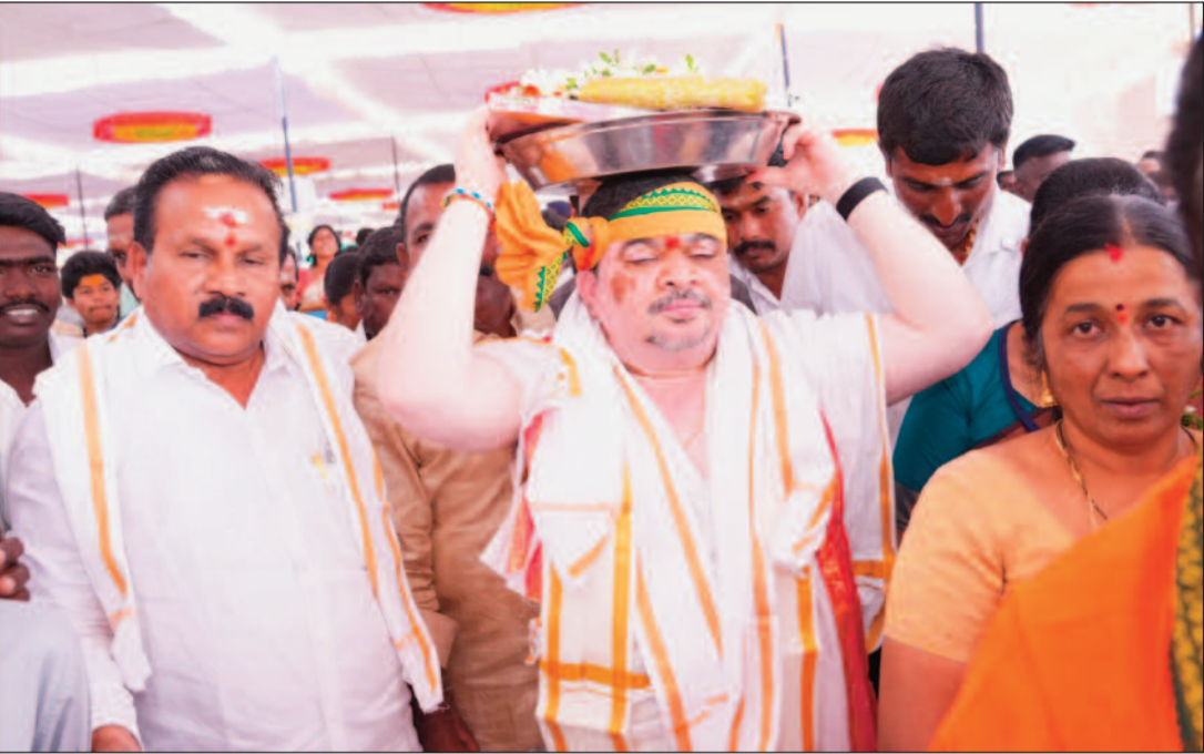
సంక్షేమ పథకాలను ప్రజలకు చేరువ చేసేవని, రాష్ట్రం ఈ కార్యక్రమంలో స్థానిక ప్రజాప్రతినిధులు, ఆలయ కమిటీ సుభిక్షంగా ఉండాలని వేడుకున్నట్లు ఆయన వెల్లడించారు. సభ్యులు మరియు కాంగ్రెస్ పార్టీ నాయకులు పాల్గొన్నారు.