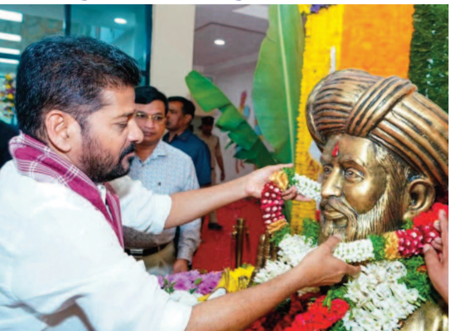
జనతా న్యూస్, హైదరాబాద్: 'నేనే రాజు.. నేనే మంత్రి' అని తాను చెప్పిన విషయాన్ని కొందరు వేరే విధంగా అర్థం చేసుకున్నారని సీఎం రేవంత్ రెడ్డి అన్నారు. తాము పాలకులం కాదని, సేవకులమని, ఈ విషయాన్ని తాను ఏనాడో చెప్పానని తెలిపారు. తాను పాలకుడిగా ఎప్పుడూ ప్రవర్తించలేదని, సేవ చేయడానికే ప్రజలు తనకు అవకాశం ఇచ్చారని స్పష్టం చేశారు. ఆదివారం హైదరాబాద్ లోని మిగతా 2 లో

ముఖ్యమంత్రిని నేనే.. మునిసిపల్ మంత్రిని నేనే.. ఎన్నికల్లో గెలుపొటములకు బాధ్యత నాదేనని అర్థం మునిసిపల్ ఎన్నికల ఫలితాలు 90%మాత్రం అనుకూలం పేదలను పరిపాలనలో భాగస్వాములను చేశాం దళితుడిని అధ్యక్షా అని మైక్ అడిగేలా పైన కూర్చోబెట్టాం ప్రభుత్వంలో 30 శాతం పదవులు ఎస్సీలకు ఇచ్చాం నల్లమలలో 20 ఎకరాల్లో సేవాలాల్ పుణ్యక్షేత్రం వచ్చే ఏడాది జయంతి వేడుకలు అక్కడే నిర్వహిస్తాం ప్రతి తండాకు బిటీ రోడ్డు, సోలార్ పంపుసిట్లు మంజూరు సంత సేవాలాల్ జయంతి వేడుకల్లో సీఎం రేవంత్ రెడ్డి