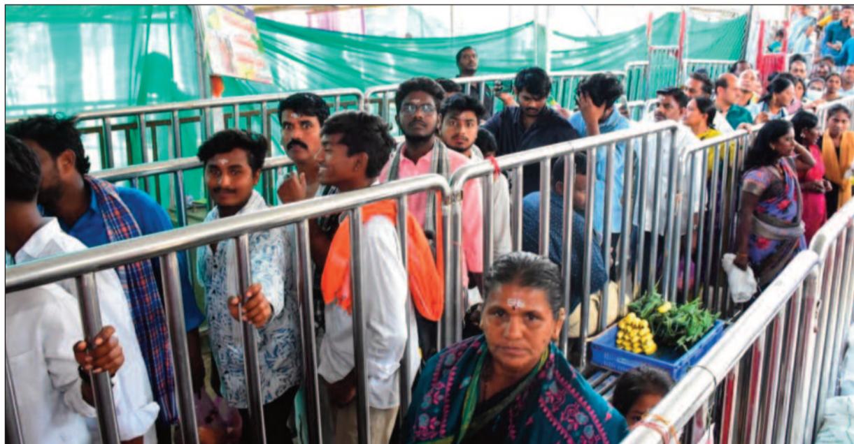
అలయ అధికారులు, ప్రజాప్రతినిధులు, భక్తులు పాల్గొన్నారు. శ్రీ భీమేశ్వరస్వామిని దర్శించుకున్న ఇంచార్జి కలెక్టర్