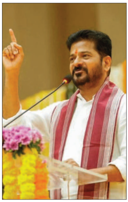
వచ్చేసారి జయంతి వేడుకలను అక్కడే నిర్వహిస్తామన్నారు. సంత సేవాలలో లంబాడీ సమాజాన్ని