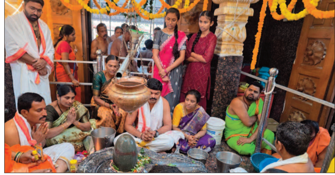
బస్యాభిషేకం, నిషి పూజ కార్యక్రమాల అనంతరం బిల్వదళ సమర్పణ తో భక్తులకు దర్శన భాగ్యం కల్పించారు. సాయంత్రం ఆలయంలో శివరామకృష్ణ భజన మండలి