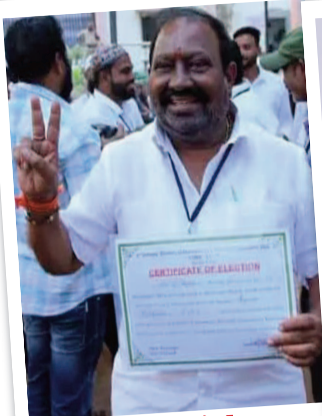
మల్లిఖార్జున రాజేందర్ (కాంగ్రెస్ బల పరచాలనుకుంటున్న అభ్యర్థి)