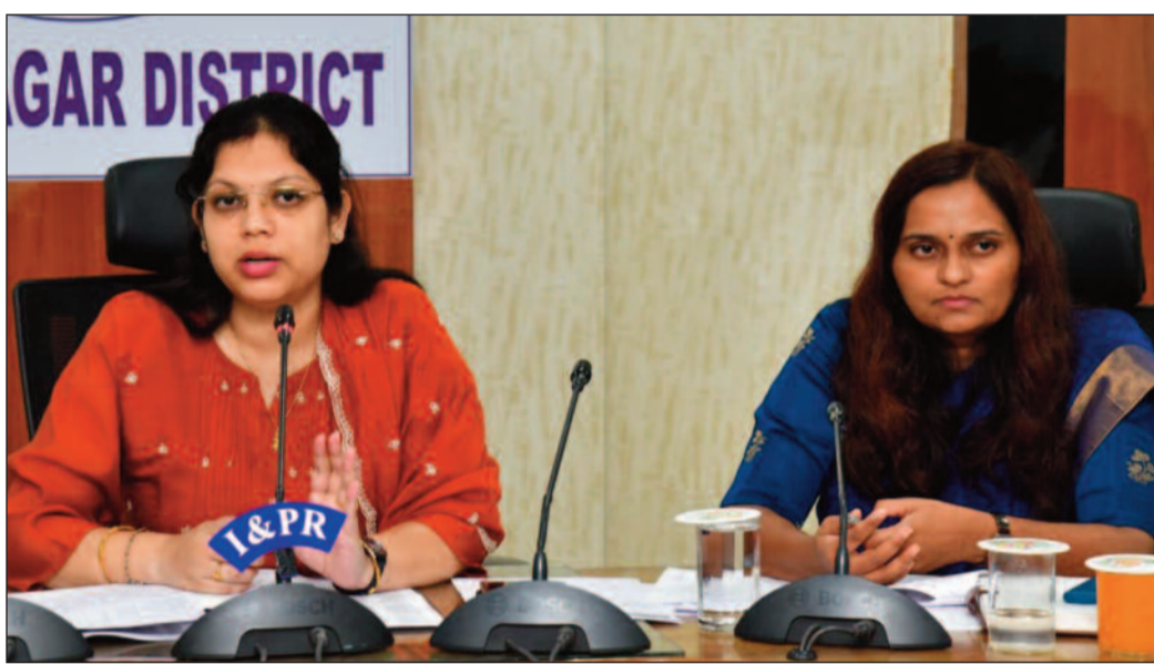
మోడల్ పరీక్షలు నిర్వహించామని, వాటి ఫలితాల ఆధారంగా వెనుకబడిన విద్యార్థులపై ప్రత్యేక శ్రద్ధ పెట్టి సూచనలు సాధించేలా కృషి చేయాలని విద్యాధికారులను ఆదేశించారు.