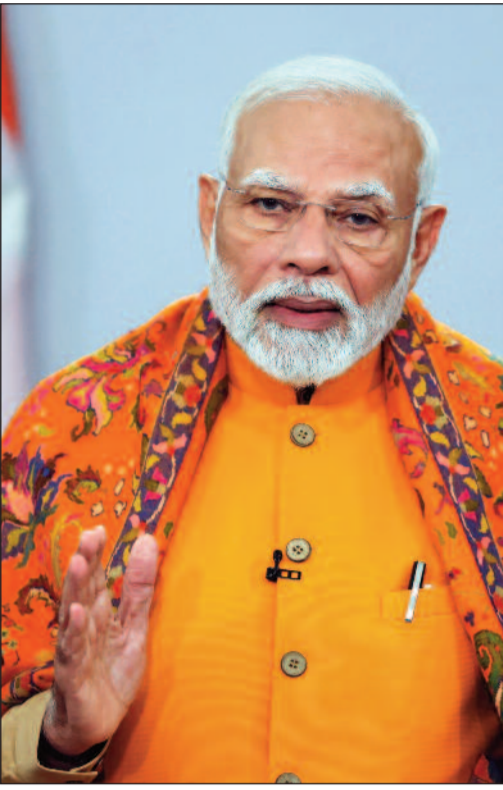
సర్వతోముఖాభివృద్ధికి ఎన్నో ప్రభుత్వం పాటుపడిందని, రైతుల సంక్షేమం నుంచి యువత కలల సాకారం,

న్యూఢిల్లీ: పశ్చిమబెంగాల్ అసెంబ్లీ ఎన్నికలు త్వరలో జరుగనున్న వేళ ప్రధాన మంత్రి నరేంద్ర మోడీ బెంగాల్ ప్రజలకు బహిరంగ లేఖ రాశారు. రాష్ట్రంలోని ప్రస్తుత పరిస్థితిపై ఆయన ఆవేదన వ్యక్తం చేశారు. మరి కొద్ది నెలరోజుల్లో బెంగాల్ భవిష్యత్తు నిర్ణయించే కీలక ఎన్నికలు జరుగ సున్నాయని, భావితరాల భవిష్యత్తును నిర్ణయించే ఈ ఎన్నికల్లో ప్రజలు వివేకవంతమైన నిర్ణయం తీసుకోవాలని కోరారు. బంగారు బంగ్లా కలల సాకారానికి తాను భరోసా ఇస్తున్నానని అన్నారు. జై మహాకాళి' అంటూ ప్రధాని తన లేఖను ప్రారంభించారు. 'మరి కొద్ది నెలల్లోనే బెంగాల్ భవిష్యత్తు నిర్ణయం కోట్లతోంది. మీరు తీసుకునే తెలివైన నిర్ణయం పైనే భావితరాల భవిష్యత్తు, దిశానిర్దేశ ఆధారపడి ఉంటుంది. సోనార్ బంగ్లా కోసం యువకులు, పెద్దలు, మహిళలు కన్న కలు కల్లుగా మిగిలిపోతున్న పరిస్థితి ఇవాళ ఉంది. వారి బాధలు నన్ను కలిచివేస్తున్నాయి. ఇందుకోసం హృదయపూర్వకంగా ఒక తీర్మానం చేసుకున్నాను. వికసిత బంగ్లా సాధనకు నిర్ణయం తీసుకున్నాను' అని ఆ లేఖలో మోడీ పేర్కొన్నారు. గత 11 ఏళ్లుగా దేశ ప్రజల ఆశీస్సుల బలంతో ప్రజాసంక్షేమానికి, దేశ