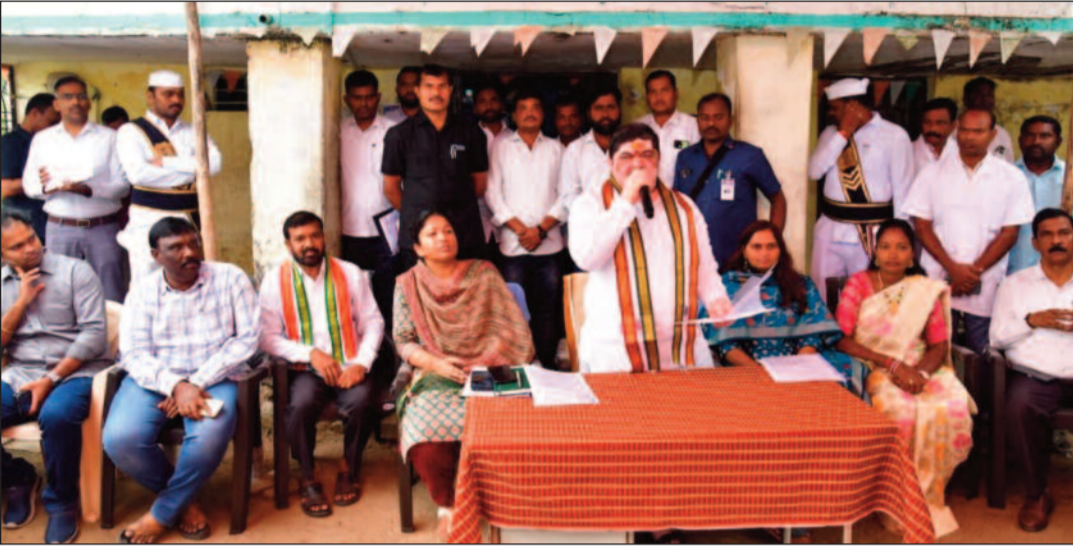
ప్రజా ప్రతినిధులు పాల్గొన్నారు.