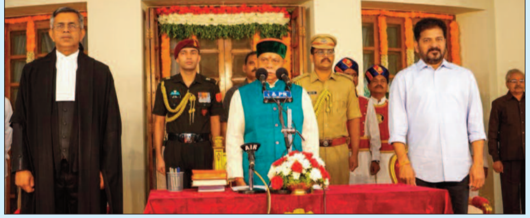
కేంద్ర ఆర్థిక శాఖ సహాయ మంత్రిగా పనిచేశారు. బాధ్యతలు నిర్వహించారు. తాజాగా తెలంగాణకు విచ్చేశారు.

హైదరాబాద్, మార్చి 11 : తెలంగాణ సూతన గవర్నర్ గా శివప్రతాప్ శుక్లా ప్రమాణం స్వీకారం చేశారు.. తెలుగులో ప్రమాణం చేయడం ఆసక్తిగా మారింది. లోక్ సభలో హైకోర్టు ప్రధాన న్యాయమూర్తి ప్రమాణ-స్వీకారం చేయించారు. ఈ కార్యక్రమానికి స్పీకర్ గడ్డం ప్రసాద్ కుమార్, మంజులై చైర్మన్ గుత్తా సుఖేందర్ రెడ్డి, సీఎం రేవంత్ రెడ్డి, డిప్యూటీ సీఎం భట్టి, మంత్రులు హాజరయ్యారు. ముందుగా పూర్తి పంచాయతీ గేయంతో కార్యక్రమం ప్రారంభమైంది. అనంతరం మంత్రులతో కలిసి గవర్నర్ గ్రూప్ ఫోటో డిగ్రా. ఇక శివ ప్రతాప్ శుక్లా విషయానికి వస్తే.. ఆయన 73 ఏళ్ల సుదీర్ఘ రాజకీయ నేపథ్యం కలిగిన నేత. ఉత్తరప్రదేశ్ కు చెందిన ఆయన, ఏబీవీపీ ద్వారా రాజకీయాల్లోకి ఎంట్రి ఇచ్చారు. ఎమ్మెల్యే సమయంలో జైలుకు సైతం వెళ్లారు. యూపీలో నాలుగుసార్లు ఎమ్మెల్యేగా, కేబినెట్ మంత్రిగా,