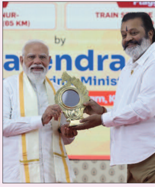
హైవేలు, రైల్వేలు, గ్రామీణ రోడ్లు వంటి కీలక రంగాలు ఉన్నాయి. వీటి వల్ల వేలాది మంది యువతకు కొత్తగా ఉద్యోగాలు వస్తాయి' అని మోదీ తెలిపారు.

తిరుచానపల్లి, మార్చి 11: తమిళనాడులో కేంద్రం పెద్దఎత్తున పెట్టుబడులు పెడుతోందని, ఇదే విషయం గతంలోనూ తాను చెప్పడం జరిగిందని ప్రధానమంత్రి నరేంద్ర మోదీ అన్నారు. అవినీతి డిఎంకే పాలనకు ఉద్ధాసన పలకాలని ప్రజలు ఇప్పటికే నిర్ణయించుకున్నట్లు చెప్పారు. తమిళనాడు అసెంబ్లీ ఎన్నికలు దగ్గరవతున్న నేపథ్యంలో తిరుచానపల్లిలో బుధవారంనాడు జరిగిన బహిరంగ సభలో ప్రధాని మాట్లాడారు. 'గత పర్యాయం తిరుచ్చి వచ్చాను. అప్పుడు రూ.20,000 కోట్లతో అభివృద్ధి పనులను ప్రారంభించాను. కొద్దిరోజుల క్రితం మదురైలో పర్యటించాను. రూ.4,400 కోట్ల విలువైన ప్రాజెక్టులు చేపట్టాం. ఈరోజు రూ.5,600 కోట్ల ప్రాజెక్టులకు సంబంధించిన ప్రోగ్రాం కోసం వచ్చాను. తమిళనాడు ఉజ్వల భవిష్యత్తు కోసం ఎన్నో పెట్టుబడులు పెడుతున్నాం. వీటిలో క్లీన్ ఎనర్జీ, మ్యూన్సిపాలిటీ, రోడ్లు, హైవేలు, రైల్వేలు, గ్రామీణ రోడ్లు వంటి కీలక రంగాలు ఉన్నాయి. వీటి వల్ల వేలాది మంది యువతకు కొత్తగా ఉద్యోగాలు వస్తాయి' అని మోదీ తెలిపారు.