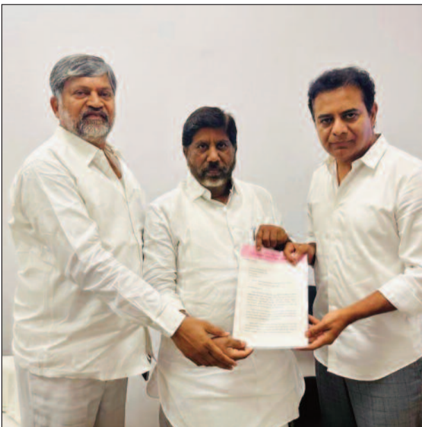
స్కామ్ అంటుందా? అని ప్రశ్నించారు. స్కాంగ్రెస్ నాయకులారా.. రండి చూసుకుందామని సవాలు విసిరారు.

హైదరాబాద్, మార్చి 25 : ఫార్ములా ఈ రేసు కేసు పేరిట రాష్ట్ర ప్రభుత్వం డైరక్షన్ పాలిటిక్స్ చేయడంపై బీఆర్ఎస్ వర్కాంగ్ ప్రెసిడెంట్ కేటీఆర్ మండిపడ్డారు. కాంగ్రెస్ అధికారంలోకి వచ్చి రెండేళ్ల నాలుగు నెలలైందని.. ప్రభుత్వానికి సంబంధించిన పత్రాలు, యంత్రాంగం అన్నీ కాంగ్రెస్ ప్రభుత్వం చేతిలో ఉన్నా.. బ్యాంక్ ద్వారా అధికారికంగా నిధులు బదిలీ చేసిన ఫార్ములా-ఈ అంశం మీద మాత్రమే కేసు పెట్టగలిగారని తెలిపారు. ఈ ఏసీబీ ఛార్జీషీట్ రేపంత్ ప్రభుత్వం ఎంత నిస్పృహలో ఉందో చూపించడమే కాకుండా, మా హయాంలో జరిగిన మచ్చలేని పాలనకు సర్టిఫికేట్ లాంటిది అయిన స్పష్టం చేశారు. బీఆర్ఎస్ పాలనలో ఎలాంటి నిబంధనలు ఉల్లంఘించలేదని ఈ ఛార్జీషీట్ ద్వారా స్పష్టం అవుతోందని కేటీఆర్ తెలిపారు. కేవలం అభివృద్ధి లక్ష్యంగా చేసుకుని విజయవంతంగా ప్రభుత్వాన్ని నడిపామని స్పష్టం చేశారు.