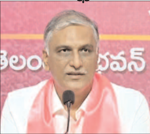
నిరసనలో రేవంట్ రెడ్డిని అనే వదం వాడినందుకు ఎఫ్ కె కమిటీకి ఫిర్యాదు చేయాలని డిమాండ్ చేశారు.