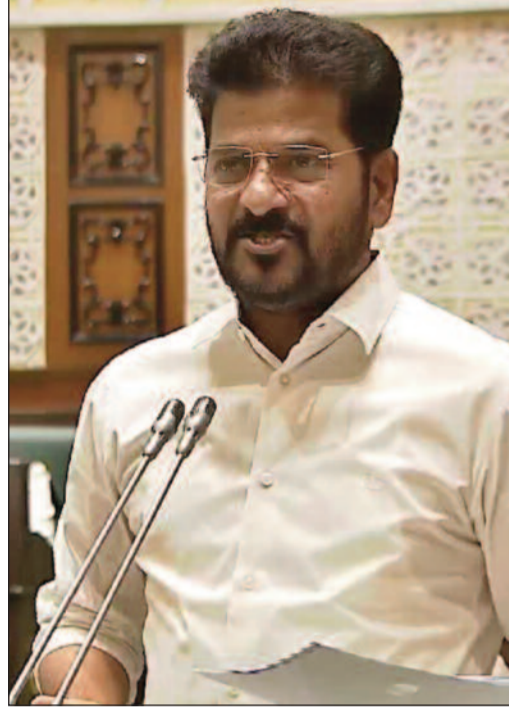
ఎందుకు ప్రశ్నించారు. హౌస్ కమిటీ పేరుతో మంత్రి పొంగులేటిని భర్తరఫ్ చేసి ధరణి పేరుతో అక్రమంగా స్వాధీనంచేసుకున్న భూములను తమపేర్పై

శాసనసభ సమావేశాలు పరస్పర ఆరోపణలు, వాగ్వివాదాలకు దారితీసింది, సభ ప్రారంభంలో మంత్రి పొంగులేటిని భర్తరఫ్ చేయాలని ప్రకారం ప్రదర్శనలు అమరవీరుల స్మారకం సుంచి ప్రదర్శనగా సభలోకి వచ్చిన బీఆర్ఎస్ శాసనసభ్యులు పట్టు సడలించకుండా సభావ్యవహారాలను, చర్చలను అడ్డుకున్నారు. స్పీకర్ పోడియం ముందుకు దూసుకువెళ్లి పద్దుల వత్రాలను చివీ విసిరేశారు. ఆ కాకితాలు సభలో చెల్లాచెదురు గా పడ్డాయి. బీఆర్ఎస్ వర్గం ప్రెసిడెంట్ కేటీ రామారావు, శాసనసభలో బీఆర్ఎస్ పక్ష నేతలు హరీష్ రావు, తలసాని శ్రీనివాస్ యాదవ్ ముందు వరుసలో నిలవగా బీఆర్ఎస్ ఎమ్మెల్యేలు పోడియం దగ్గర పెట్టున నినాదాలు చేస్తూ చప్పుట్లు కొడుతూ సభకు అంతరాయం కలిగించారు. పద్దులపై చర్చకు అడ్డుపడ్డారు. అక్రమమైనింగ్ వ్యవహారంలో ఆధారాలన్నీ నేపథ్యంలో రాఫువ కన్స్ట్రక్షన్ వ్యవహారంకు మంత్రి పొంగులేటి శ్రీనివాస్ రెడ్డిని భర్తరఫ్ చేయాలని, సభా సంఘం వేసి విచారణ జరపాలని నినాదాలు చేశారు. సుమారు మూడుగంటల పాటు సభ బీఆర్ఎస్ సభ్యుల నినాదాలతో దద్దరిల్లింది. ఈ నేపథ్యంలో సీఎం రేవంత్రి జోక్యం చేసుకుని సభాసంప్రదాయాలను పాటించి చర్చలో పాల్గొనాలని విజ్ఞప్తి చేశారు. అక్రమమైనింగ్ వ్యవహారంలో సీబీసీఐడికి ఆదేశించిన నేపథ్యంలో హౌస్ కమిటీ