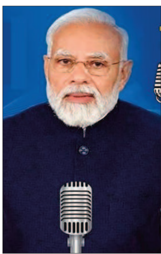
వదంతులను నమ్మి మోసపోవద్దు..

న్యూఢిల్లీ: ప్రపంచంలోని వివిధ ప్రాంతాల్లో యుద్ధ ఘోరణ పరిస్థితులు నెలకొన్నాయని, ఏ కష్టమొచ్చినా కలిసికట్టుగా ఎదురుకుండామని ప్రధానమంత్రి నరేంద్ర మోడీ పేర్కొన్నారు. కోవిడ్ కారణంగా యావత్ ప్రపంచం చాలా కాలంపాటు అనేక సమస్యలను ఎదుర్కొన్న సందర్భం మనందరికీ గుర్తుంది.. ఆ సంక్షోభాన్ని అధిగమించిన తర్వాత, ప్రపంచం ప్రగతిపథంలో ముందుకు సాగుతుందని అందరూ ఆశించారు.. అయితే, పశ్చిమాసియాలో నెలకొన్న పరిస్థితుల దృష్ట్యా ఇప్పుడు మనం ఈ సంక్షోభం నుండి మరోసారి ఐక్యంగా బయటపడాలి ఉండని ప్రధానమంత్రి అన్నారు. ఆదివారం ప్రధానమంత్రి నరేంద్ర మోడీ ఆల్ ఇండియా రేడియో మన్ కీ బాత్ కార్యక్రమం 132వ ఎపిసోడ్లో దేశ ప్రజలను ఉద్దేశించి ప్రసంగించారు. ప్రస్తుతం యుద్ధంలో ఉన్న ప్రాంతం మన ఇంధన అవసరాలకు కేంద్ర బిందువని ప్రధాని పేర్కొన్నారు. ఇది పెట్రోల్, డీజిల్ విషయంలో ప్రపంచ సంక్షోభానికి దారితీస్తున్నదన్నారు. మన దౌత్య సంబంధాలు, వివిధ దేశాల నుండి మనకు లభించే మద్దతు, గత దశాబ్ది కాలంలో మనం నిర్మించుకున్న బలాలూ ఈ సవాళ్లను దైర్ఘ్యంగా ఎదుర్కోవడానికి మనదేశానికి దోహదపడతాయని తెలిపారు. ప్రస్తుతం నిస్సందేహంగా సవాళ్ల తో కూడిన సమయం అని, ఈసవాళ్లు అధిగమించడానికి పౌరులంతా ఏకం కావాలనిమోడీ మరోసారి పిలుపునిచ్చారు.