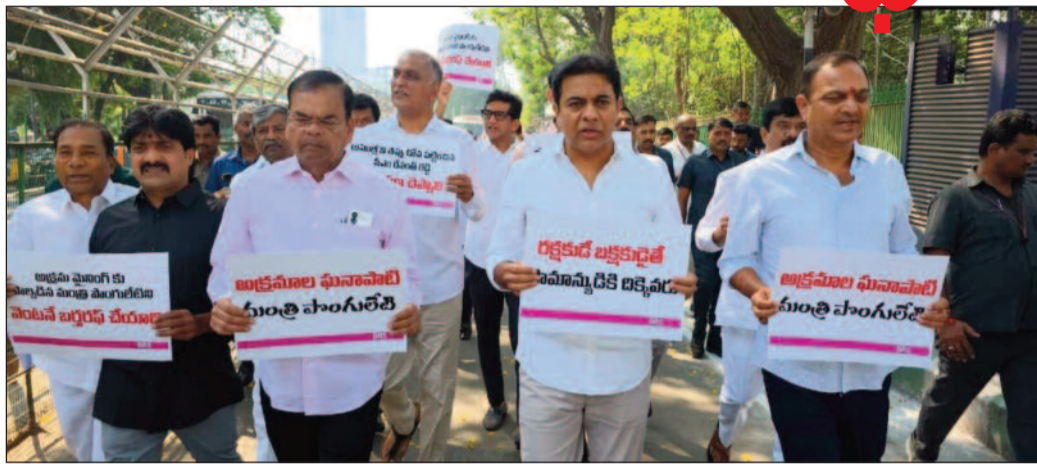
ప్రజల సంపదను కాపాడేందుకు ఎంతటి త్యాగాలకైనా సిద్ధంగా ఉన్నామని బీఆర్ఎస్ వర్కింగ్ ప్రెసిడెంట్ కేటీ రామారావు స్పష్టం చేశారు. పోరాడి సాధించుకున్న తెలంగాణ సంపదను రేవంట్ రెడ్డి ప్రభుత్వం దోచుకుంటుంటే అడ్డుకట్టవేసి గూతుకునేబాధ్యత ప్రజలపై, ప్రతిపక్షంపై ఉందని గూర్చిచేశారు. అక్రమ మైనింగ్ వేల కోట్లకోట్లపై చేస్తున్న మంత్రి పాంగులేటిని తక్షణం వదలి నుంచి భర్దరఫ్ చేయడం తో పాటు హాస్ కమిటీ వేసి విచారించేంతవరకు రేవంట్ రెడ్డి సర్కారు వదిలి ప్రసక్తే లేదని హెచ్చరించారు. అక్రమ మైనింగ్ పై హాస్ కమిటీ వేయాలని డిమాండ్ చేస్తూ ఆసెంబ్లీ ముందున్న అవినీతిని సమీక్షించే దగ్గర బీఆర్ఎస్ శాసనసభ్యులు, శాసన మండలి సభ్యులు ప్రకారాలు ప్రదర్శిస్తూ ఆదివారం ధర్నాచేశారు. ఈ కార్యక్రమంలో కేటీఆర్ మీడియా తో మాట్లాడుతూ రాష్ట్ర ప్రభుత్వంలో రెండవ స్థానంలో ఉన్న మంత్రి పాంగులేటి కుంభకోణాలను ప్రజల్లోకి తీసుకువెళ్లుతున్నట్లు తెలిపారు. రేవంట్ రెడ్డి అక్రమాలతో పాటు పాంగులేటి అక్రమ మైనింగ్ వ్యవహారంపై రాష్ట్ర గవర్నర్ శివప్రతాప్ శుక్లాకు ఫిర్యాదు చేయనున్నట్లు కేటీఆర్ హెచ్చరించారు. మంత్రికి చెందిన రాఘవ కన్నకొండ అవినీతి కుంభకోణాలను సభలో హాట్ రావు ఆధారాలతో నిరూపించిన హాస్ కమిటీ ఎందుకు వేయలేదని ఆయన ప్రభుత్వాన్ని