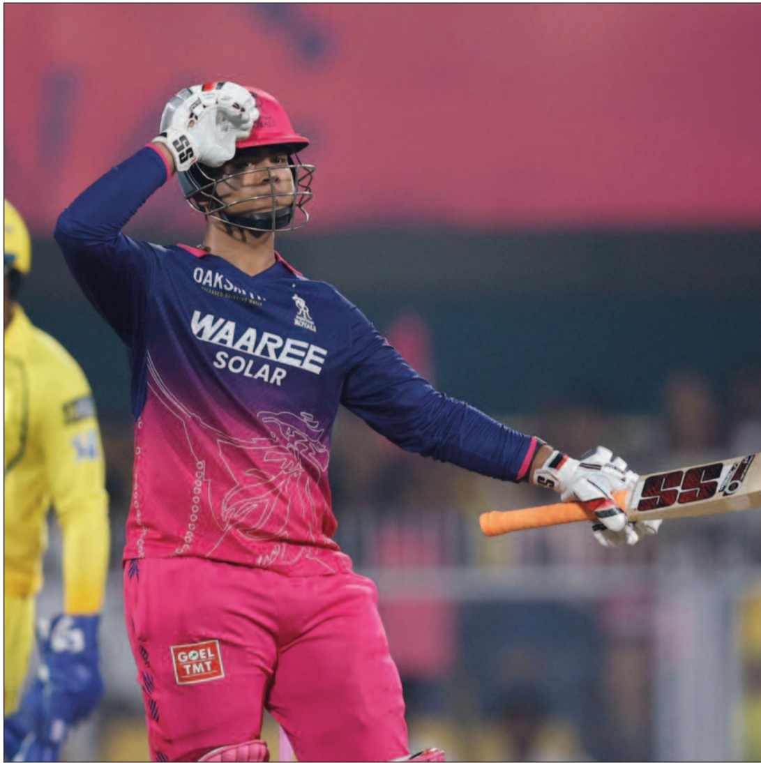
రాజస్థాన్ బౌలర్లలో జోషా ఆర్పర్, నండే బర్గర్, రవీంద్ర శాసించారు. ఆల్ రౌండ్ ప్రదర్శనతో రాజస్థాన్ ఈ జిడ్జా తలో రెండు వికెట్లు పడగొట్టి చెన్నై పతనాన్ని సీజన్లో తమ జైత్రయాత్రను ఘనంగా ప్రారంభించింది.