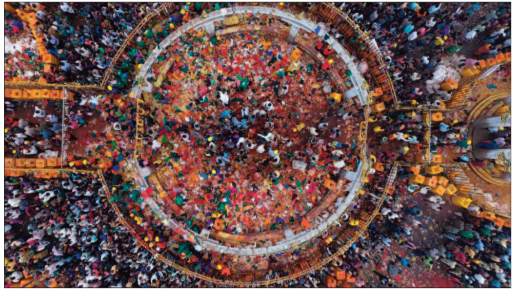
గద్దెల ప్రాంగణం విస్తరణతో సులుభంగా దర్శనాలు