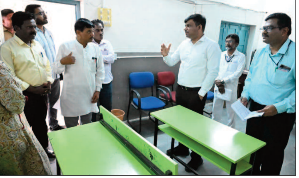
రూట్ల ప్రకారం అవసరమైన బస్సులు ఏర్పాటు చేసేలా సమావేశంలో ఇంజనీరింగ్, టౌన్ ప్లానింగ్ అధికారులు చర్యలు తీసుకోవాలని అధికారులను ఆదేశించారు. ఈ పాల్గొన్నారు.