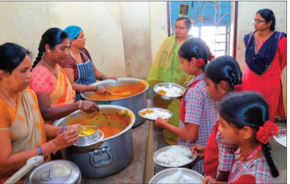
కూడా ఆదాలని విద్యార్థులకు చెప్పారు. పిల్లలకు పడవద్దని, క్రమశిక్షణతో విద్యార్థులను నేర్పించాలని భోజనం, వసతి, చదువు విషయాల్లో ఎలాంటి రాజీ ప్రాప్తిపల్, ఉపాధ్యాయులను కలెక్టర్ ఆదేశించారు.