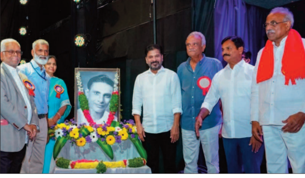
ధ్యమకారుడెలా అయితారు?” అని రేవంత్ అన్నారు.

రాచరిక పోకడలు, అరాచక శక్తులకు వ్యతిరేకంగా తెలంగాణ సాయుధరైతాంగ పోరాటంలో నాయకత్వ స్థానాన్ని నిలిపి పోరాడిన గొప్ప సాహసీ రావి నారాయణరెడ్డి అంటూ సీఎం రేవంత్ కొనియాడారు. భూస్వామ్య కుటుంబంలో పుట్టినా పేద ప్రజల కోసం 500 ఎకరాలు దానం చేసిన మానవతామూర్తి అని అన్నారు. 60 ఏళ్లు దాటిన తర్వాత ప్రజలకు స్ఫూర్తినిస్తూ.. పార్టీ, రాజకీయ పదవుల నుంచి స్వచ్ఛందంగా వైదొలిగిన గొప్పనేత రావి నారాయణరెడ్డి అని శ్లాఘించారు. ఆయన త్యాగాలు ఆదర్శనీయమని, ఆయన జ్ఞాన్యాన్ని భావిశరాలకు చాటితూ మంచి కార్యక్రమాలు చేపట్టే బాధ్యత తమ ప్రభుత్వానిదని ప్రకటించారు. “ప్రపంచంలో ఎక్కడైనా స్వేచ్ఛ, స్వాతంత్ర్యం, మానవ హక్కుల కోసం కొట్లాడిన చేగువేరా మొదలు రావి నారాయణరెడ్డి వరకు ఎంతోమంది సర్వం కోల్పోయారు. ఆస్తులు, అంతస్తులు త్యాగం చేశారు. అలాంటి త్యాగధనులను జాతిపితలుగా, ఉద్యమకారులుగా ప్రజలు కీర్తించారు. అంతేకాదు.. వచ్చిన తెలంగాణ రాష్ట్రంలో పదవులన్నీ మీరే తీసుకుంటిరి. వందల ఎకరాల ఫామ్ హాచిస్ ను మీరే వచ్చి, టీవీలు, పత్రికలు, వేలకోట్ల రూపాయల వ్యాపారాలు మీరే వచ్చి. చేయాలన్న తప్పులన్నీ మీరే చేస్తే, కాంట్రాక్టులు మీరే పంచుకుంటిరి. ఇంత చేసిన తర్వాత మీరెట్లా జాతిపిత అయితారు? ఉ