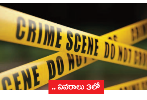
.. వివరాలు 3లో

తెలుగు సిని పరిశ్రమకు తెలంగాణ ప్రభుత్వం పూర్తి ప్రాధాన్యత ఇస్తోందని డిప్యూటీ సీఎం భట్టి విక్రమార్కు స్పష్టం చేశారు. బుధవారం సచివాలయంలో గద్దర్ అవార్డుల జ్యూరీ సభ్యులతో డిప్యూటీ సీఎం కీలక సమావేశం నిర్వహించారు. హైదరాబాద్ను ఫిల్మ్ ఇండస్ట్రీ కేంద్రంగా చేయాలనే అక్షయతో ప్రభుత్వం పనిచేస్తోందని అన్నారు. అన్ని భాషల సిని పరిశ్రమలు ఇక్కడికి విస్తరించేలా అనుకూల వాతావరణం కల్పిస్తామన్నారు.