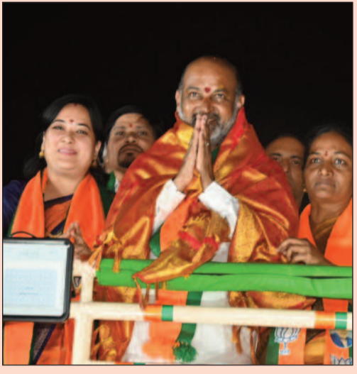
చేశారని బండి సంజయ్ మండిపడ్డారు. తక్షణమే విధుల్లోంచి తప్పించకపోతే తీవ్ర పరిణామాలుంటాయని హెచ్చరించారు.