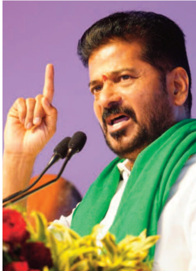
మిర్యాలగూడ : రాష్ట్రంలో జరిగిన అభివృద్ధిని చూసి మున్సిపల్ ఎన్నికల్లో ప్రజలు తీర్పు ఇవ్వాలని ముఖ్యమంత్రి రేవంత్ రెడ్డి విజ్ఞప్తి చేశారు. మున్సిపల్ ఎన్నికల్లో కాంగ్రెస్ను గెలిపించాలి. ఎన్నికల్లో కాంగ్రెస్కు ఎదురే లేదు.. విజయాన్ని అడ్డుకోలేరని అన్నారు. మిర్యాలగూడ మండలం గూడూరులో యంగ్ ఇండియా రెసిడెన్షియల్ స్కూల్కు శంకుస్థాపన చేసిన అనంతరం ఏర్పాటు చేసిన ‘ప్రజా పాలన - ప్రజా విజయోత్సవ’ సభలో

“భార్యభర్తలు మాట్లాడుకుంటే దొంగచాటుగా విన్న సన్నాసివి, సువ్వెలా జాతిపిత అవుతావు?” అని మాజీ ముఖ్యమంత్రి కేసీఆర్ రైతులకు సీఎం రేవంత్ రెడ్డి తీవ్రస్థాయిలో విరుచుకుపడ్డారు. ఫోన్ ట్యాపింగ్ కేసును ఉద్దేశించి ఆయన ఘాటు వ్యాఖ్యలు చేశారు. నల్గొండ జిల్లా మిర్యాలగూడలో బుధవారం జరిగిన ‘ప్రజా పాలన ప్రగతిబాటు’ భారీ బహిరంగ సభలో ఆయన ప్రసంగించారు. ఈ సందర్భంగా కేసీఆర్ కుటుంబంపై, బీఆర్ఎస్ నేతలపై నిప్పులు చెరిగారు.