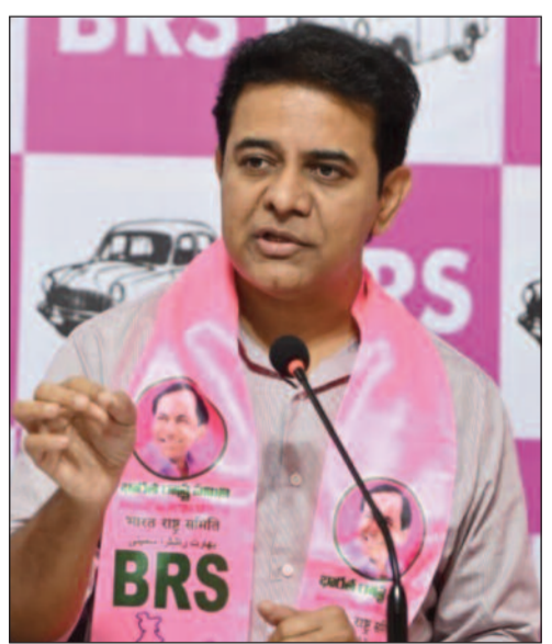
అందులో కేవల్ఎస్ఆర్ కంపెనీ రేవంత్ రెడ్డి బినామీ కంపెనీ అని ఐటీ శాఖ అనుమానం వ్యక్తం చేసిందన్నారు. కేవల్ఎస్ఆర్ కంపెనీలో రేవంత్ రెడ్డి బినామీ పెట్టుబడులు ఉన్నాయని 2018లోనే ఐటీ చెప్పిందని గుర్తుచేశారు. రేవంత్ రెడ్డి సీఎం కాగానే కేవల్ఎస్ఆర్ కు

హైదరాబాద్, ఫిబ్రవరి 4 : తెలంగాణ కాంగ్రెస్ ప్రభుత్వం, సీఎం రేవంత్ రెడ్డిపై బీఆర్ఎస్ వర్కింగ్ ప్రెసిడెంట్ కేటీఆర్ తీవ్ర ఆరోపణలు చేశారు. బుధవారం మోడీయాతో మాట్లాడుతూ.. కాంగ్రెస్ న్యాయాలను ఒక్కొక్కటిగా బయటపెడుతున్నామని, మూసీ నది పేరిట లక్షల కోట్ల డోపింగ్ బీఆర్ఎస్ అడ్డుకుందని అన్నారు. లగవర్తల్ అల్లడి కంపెనీ కోసం గిరిజనుల భూములు లాక్కోవాలని చూస్తే బీఆర్ఎస్ అడ్డుకుందని, హిల్ పాలనలో లక్షల కోట్ల కుంభకోణాన్ని బీఆర్ఎస్ బయటపెట్టించి చెప్పారు. అలాగే, సింగరేణి అవినీతిని తమ పార్టీ బయటపెట్టించిన కేటీఆర్ వెల్లడించారు. కేవల్ఎస్ఆర్ ఇన్నా కంపెనీని సీఎం రేవంత్ రెడ్డి బినామీ కంపెనీగా కేటీఆర్ అభివర్ణించారు. జనవరి 23న కేంద్ర, రాష్ట్ర ప్రభుత్వాలకు కేవల్ఎస్ఆర్ పై సుప్రీంకోర్టు నోటీసులు ఇచ్చిందని, దివాళా తీసిన కంపెనీకి కాంట్రాక్టులు ఎలా ఇస్తున్నారని సుప్రీంకోర్టు ప్రశ్నించినది ఆయన చెప్పారు. కేవల్ఎస్ఆర్ ఇన్స్ట్రక్టు రూ.6 వేల కోట్ల టెండర్లు ఇచ్చారన్నారు. రేవంత్ రెడ్డి బినామీ చీఫ్ మినిస్టర్ అని, ఆయన్ను వెనుక నుంచి వేరే వాళ్లు నడిపిస్తున్నారని కేటీఆర్ ఆరోపించారు. కొడంగల్ లిట్ల ఇరిగేషన్ ప్రాజెక్టును కేవల్ఎస్ఆర్ అప్పగించారని కేటీఆర్ తెలిపారు. రేవంత్ రెడ్డిపై గతంలో రెన్సీ జరిగితే