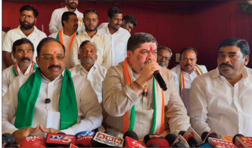
రేషన్ కార్డుల మంజూరు వంటి ఎన్నో సంక్షేమ పథకాలను అమలు చేస్తోందని తెలిపారు. బుడగ జంగాల అభివృద్ధికి కాంగ్రెస్ ప్రభుత్వం పూర్తి స్థాయిలో కట్టుబడి ఉందని పేర్కొన్నారు. ప్రజలు కోరిన విధంగా బుడగ జంగాల కమ్యూనిటీ హాల్ ను పూర్తి చేస్తామని, రేషన్ షాపు, అంగన్వాడీ కేంద్రాన్ని ఏర్పాటు చేస్తామని హామీ ఇచ్చారు. కాంగ్రెస్ పార్టీ అభ్యర్థికి ఓటు వేసి గెలిపించాలని విజ్ఞప్తి చేశారు. మంత్రి తుమ్మల నాగేశ్వరరావు మాట్లాడుతూ.. హుస్సాబాద్ ఎమ్మెల్యే తనకు అత్యంత ఆప్తుడని, పని చేసే నేతకు ప్రజలు అండగా నిలవాలని అన్నారు. ఆర్డీసీ ఉచిత ప్రయాణ పథకానికి ఇప్పటివరకు రూ.10 వేల కోట్లకు పైగా ఖర్చు చేసినట్లు తెలిపారు. ఇది ప్రజల సంక్షేమానికి కాంగ్రెస్ ప్రభుత్వం ఎంత ప్రాధాన్యం ఇస్తోందానికి నిదర్శనమని పేర్కొన్నారు. ఇప్పటికే రేషన్ కార్డులు మంజూరు చేసి, సన్న బియ్యం పంపిణీ చేస్తున్నామని చెప్పారు. కాంగ్రెస్ పార్టీ అభ్యర్థుల తరఫున ఇంటింటికీ తిరిగి ప్రచారం చేసి అభ్యర్థులను విజయం వైపు నడిపించాలని ఓటర్లను కోరారు. హుస్సాబాద్ లో అన్ని స్థానాల్లో కాంగ్రెస్ అభ్యర్థులు గెలిస్తే మరిన్ని నిధులు తీసుకొచ్చి పట్టణాన్ని మరింత అభివృద్ధి చేస్తామని తెలిపారు.

హుస్సాబాద్, జనతా న్యూస్: హుస్సాబాద్ మున్సిపాలిటీని ఎన్నికల్లో భాగంగా కాంగ్రెస్ పార్టీ అభ్యర్థులకు మద్దతుగా రాష్ట్ర మంత్రులు తుమ్మల నాగేశ్వరరావు, పాన్సం ప్రభాకర్ ఎన్నికల ప్రచారం నిర్వహించారు. ఈ సందర్భంగా వారు కాంగ్రెస్ ప్రభుత్వ సంక్షేమ పథకాలను ప్రజలకు వివరించి, అభ్యర్థులను భారీ మెజార్టీతో గెలిపించాలని కోరారు. మంత్రి పాన్సం ప్రభాకర్ మాట్లాడుతూ.. హుస్సాబాద్ ఎమ్మెల్యేగా ఎన్నికైన నాటి నుంచి ప్రజలకు నిరంతరం అందుబాటులో ఉంటూ సమస్యల పరిష్కారానికి కృషి చేస్తున్నామన్నారు. కాంగ్రెస్ ప్రభుత్వం ఇందిరమ్మ ఇళ్ల పథకం, 200 యూనిట్ల ఉచిత విద్యుత్, మహిళా సంఘాలకు వడ్డీలేని రుణాలు, సన్న బియ్యం పంపిణీ, కొత్త