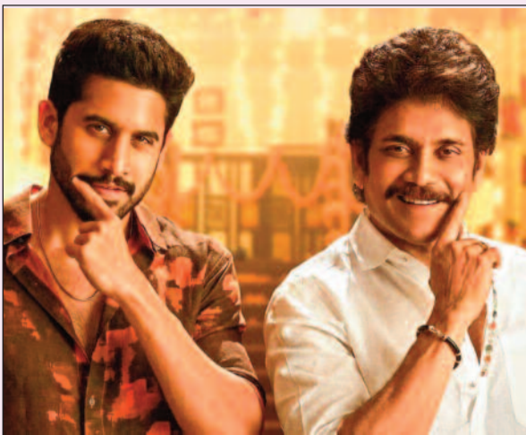
లాంటి ఫ్యామిలీ ఎంటర్టైన్ గా ఉండొచ్చని సినీ ప్రియులు అంచనా వేస్తున్నారు. గతంలో అన్నపూర్ణ స్టూడియోస్ నుంచి వచ్చిన సోగ్గాడే చిన్నినాయనా, బంగారాజు సినీమాలు 2016, 2022 సంక్రాంతి సీజన్లలోనే వచ్చి మంచి విజయాలు

సంక్రాంతి సీజన్ అంటే టాలీవుడ్ కు అనలైన పండుగ అని చెప్పడంలో డౌట్ అక్కర్లేదు. పెద్ద హీరోల సినిమాలు, ఫ్యామిలీ స్టోరీలకు కలిసొచ్చే సమయం ఇదే. అయితే ప్రతి ఏడాది లాగానే 2027 సంక్రాంతికి కూడా భారీ చిత్రాల సందడి ఉండబోతోందనే ఇప్పటికే క్షారిటీ వచ్చింది. అదే సమయంలో తాజాగా టాలీవుడ్ ప్రముఖ నిర్మాణ సంస్థ అన్నపూర్ణ స్టూడియోస్ చేసిన ఒక్క ట్వీట్ ఇప్పుడు సినీ వర్గాల్లో చర్చనీయాంశంగా మారింది. "వాసి వాడి తస్మాదియ్యా.. వచ్చే 15వ జనవరి 2027 సంక్రాంతికి సోగ్గాళ్లు వస్తే పండగ ఇంకా కలర్ ఫుల్ గా ఉంటాది కదా.. డేట్ మార్చే చేసుకోండి" అంటూ ఎమోజీలతో చేసిన పోస్ట్ వైరల్ అవుతోంది. ఆ క్విస్ నేని అభిమానుల్లో ఒక్కసారిగా జోష్ నింపుతోంది. ఆ ఒక్క లైన్ తోనే సంక్రాంతి రిలీజ్ ను అధికారికంగా అన్నపూర్ణ స్టూడియోస్ ప్రకటించినట్లే.