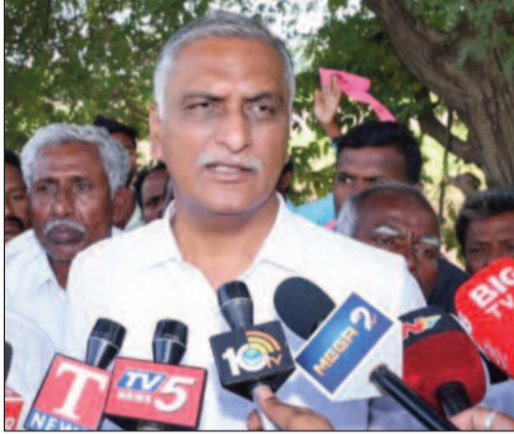
అసెంబ్లీ వేదికగా నిలదీసామని భరోసా ఇచ్చారు. రిటైర్డ్ ఉద్యోగులకు బెన్ ఫిట్లు చెల్లించకపోవడానికి కారణం డబ్బులు లేక కాదు. ముఖ్యమంత్రికి మనసు రాక అని

హైదరాబాద్, మార్చి 12 : ప్రభుత్వ ఉద్యోగ, ఉపాధ్యాయులు, రిటైర్డ్ ఉద్యోగుల పై ముఖ్యమంత్రి కరుణంగా వ్యవహరిస్తున్నారని మాజీ మంత్రి, ఎమ్మెల్యే హారీష్ రావు ఆరోపించారు. ఉద్యోగులకు రావలసిన హక్కులను వేడుకోవాల్సిన పరిస్థితి ఏర్పడడం దురదృష్టకరమని అన్నారు. తెలంగాణ రిటైర్డ్ ఎంప్లాయిస్ అసోసియేషన్ ప్రతినిధులు గురువారం హారీష్ రావును కలిసి వినతి పత్రం అందచేశారు. ప్రభుత్వ తీరు వల్ల బెన్ ఫిట్లు, పెన్షన్ బకాయిలు రాక మనోవేదనకు గురి ఎంతో మంది ప్రాణాలు కోల్పోతున్నారని, వందల సంఖ్యలో అనారోగ్యం పాలై ఆసుపత్రుల చుట్టూ తిరుగుతున్నారని విమర్శించారు. ప్రభుత్వం బకాయిలు చెల్లించే వరకు ప్రభుత్వాన్ని వదిలి పెట్టబోమని, రిటైర్డ్ ఉద్యోగుల పోరాటానికి బీఆర్ఎస్ అండగా అంటుందని,