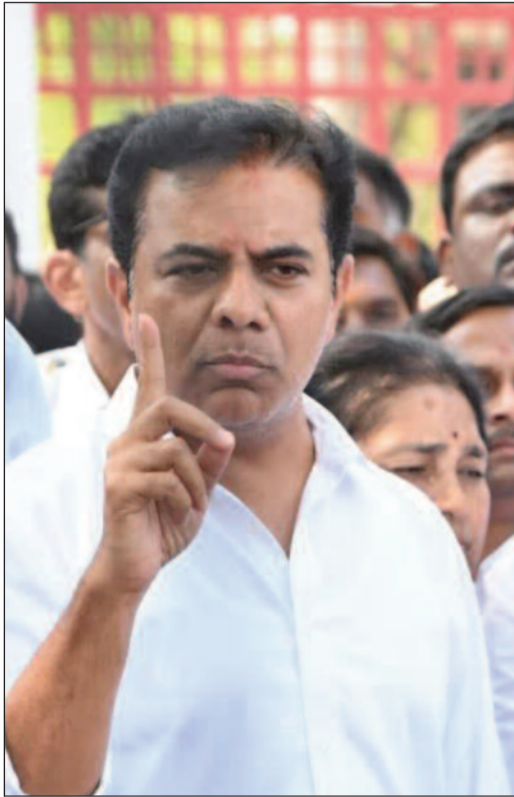
హోటళ్లు, చిన్న ఆహార వ్యాపారులు తీవ్రంగా ప్రభావితమవుతున్నాయని కేటీఆర్ తన లేఖలో ఆందోళన

ఎల్వీజీ సిలిండర్ల కొరతపై కేంద్రానికి కేటీఆర్ లేఖ హోటళ్లు, హాస్టళ్లు మూతపడే ప్రమాదమని హెచ్చరిక చిన్న వ్యాపారులకు ప్రాధాన్యత ఇవ్వాలని సూచన బ్లాక్ మార్కెట్పై కఠిన చర్యలు తీసుకోవాలని డిమాండ్ గ్యాస్ ఆధారిత శ్వశానవాటికలను అత్యవసర సేవలుగా గుర్తించాలని విజ్ఞప్తి