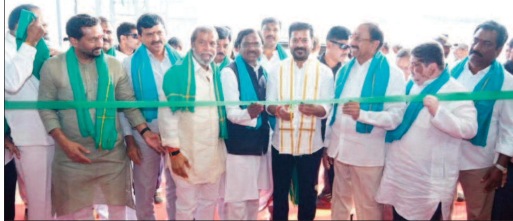
సూక్ష్మ సం ప్రక్షాళన చేసే బాధ్యత నాదేనని చెప్పారు. సాంకేతిక వైపున వైపు మనం వేగంగా అడుగులు వేయాల్సిన అవసరం ఎంతైనా ఉందన్నారు.