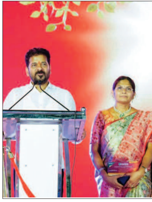
తెలంగాణ ఆర్థిక వైఖ్య కార్పొరేషన్ ఆధ్వర్యంలో ఎల్వీ స్టేడియంలో నిర్వహించిన “శ్రీ వాసవి మహాశక్తి మహోత్సవం” కార్యక్రమంలో సీఎం రేవంత్ ముఖ్య అతిథిగా పాల్గొన్నారు. ఆ సందర్భంగా ఆయన మాట్లాడుతూ... కాంగ్రెస్ పార్టీ ఎప్పుడు అధికారంలో ఉన్నా.. ఆర్థికవైఖ్యలకు రాజకీయంగానే కాదు.. ప్రభుత్వంలో కూడా సముచిత ప్రాధాన్యత దక్కుతూ వస్తున్నదని అన్నారు. ప్రస్తుత ప్రజా ప్రభుత్వంలోనూ తెలంగాణ ఆర్థికంగా, సామాజికంగా అభివృద్ధి చెందాలన్న ఆశయంతో ఆర్థిక వైఖ్యలను భాగస్వామ్యం చేస్తున్నామని తెలిపారు. రాష్ట్రవ్యాప్తంగా ఆర్థిక వైఖ్యలకు 6 మున్సిపల్ చైర్మన్ పదవులతో పాటు ఒక మేయర్ పదవి ఇచ్చి

హైదరాబాద్ : దేశ నిర్మాణంలో, అభివృద్ధిలో సామాజిక చైతన్యం లో ఆర్థికవైఖ్యల భాగస్వామ్యం అజరామరమని రాష్ట్ర ముఖ్యమంత్రి ఎన్మమల రేవంత్ రెడ్డి కొనియాడారు. తెలంగాణ పునర్ నిర్మాణంలోనూ వారు క్రియాశీల భూమిక పోషించారని స్పష్టం చేశారు. ఆదివారం