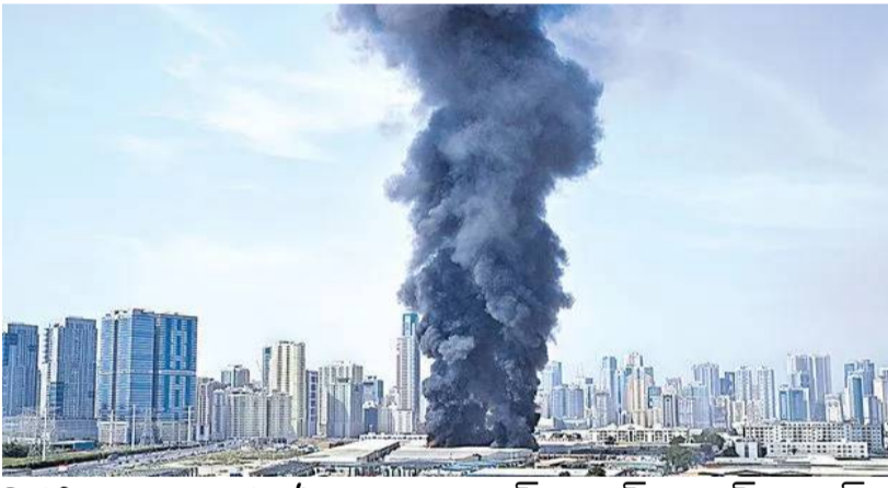
నిర్వహించాయి. యూఏఈ, బహ్రైన్, ఒమన్, ఖతార్, కువైట్, సౌదీ అరేబియా విదేశాంగ మంత్రులు ఈ సమావేశంలో పాల్గొన్నారు. 'ఇరాన్ దాడులను చూస్తూ ఊరుకోం. మమ్మల్ని మేం రక్షించుకుంటాం. దేశాలు ఇరాన్ పై తిరిగి దాడి చేసే హక్కు మాకు ఉంది. మా పౌరుల రక్షణకు చర్యలు తీసుకుంటాం' అని గల్ఫ్ దేశాలు తేల్చి చెప్పాయి.

న్యూఢిల్లీ, మార్చి 2: అమెరికా - ఇజ్రాయెల్ దేశాలు ఇరాన్ తో యుద్ధం చేస్తున్న సంగతి తెలిసింది. యుద్ధం కారణంగా ప్రపంచవ్యాప్తంగా ఉద్రిక్త పరిస్థితులు నెలకొన్నాయి. ఈ నేపథ్యంలో భారత ప్రధాని నరేంద్ర మోదీ ఇజ్రాయెల్ ప్రధాని నెతన్యాయుకు ఫోన్ చేశారు. ఇరాన్ తో యుద్ధం, తాజా పరిణామాలపై నెతన్యాయుతో చర్చించారు. శాంతి దిశగా చర్యలు తీసుకోవాలని మోదీ కోరారు. ఫోన్ సంభాషణల తాలూకా విషయాలపై ప్రధాని మోదీ ఎక్స్ వేదికగా సోమవారం ఓ పోస్టు పెట్టారు.ఆ పోస్టులో.. 'ప్రస్తుత పరిస్థితులపై చర్చించేందుకు ప్రధాని బెంజమిన్ నెతన్యాయుతో టెలిఫోన్ లో మాట్లాడాను. తాజా పరిణామాలపై భారత్ ఆందోళన వ్యక్తం చేస్తోందని చెప్పాను. పౌరుల భద్రతకు అత్యంత ప్రాధాన్యం ఇవ్వాలని పేర్కొన్నాను. యుద్ధాన్ని త్వరితగతిన నిలిపివేయాల్సిన అవసరాన్ని భారత్ పునరుద్ఘాటిస్తోంది' అని రాసుకొచ్చారు.ఇరాన్ దాడులపై గల్ఫ్ దేశాల సమావేశంఇరాన్ దాడులపై గల్ఫ్ దేశాలు సమావేశం