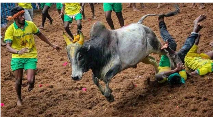
సంప్రదాయ క్రీడగా ప్రజలు జరుపుకొంటారు. ఈ క్రీడలను చూసేందుకు ఏపీ, తెలంగాణ ప్రజలు భారీగా తమిళనాడుకు తరలివస్తారు. పరుగులు తీస్తున్న పశువులను పట్టుకోవడానికి యువకులు ఉత్సాహంగా పోటీపడి పరుగెడతారు. ఇలాంటి సమయంలో కొన్నిసార్లు ఇలాంటి ప్రమాదాలు చోటు చేసుకుంటుంటాయి.

తమిళనాడు, మార్చి 02: శివగంగై జిల్లాలో ఏర్పాటు చేసిన జిల్లకట్టులో తీవ్ర విషాదం నెలకొంది. సోమవారం జరిగిన ఈ క్రీడలో ఎద్దు పొడవడంతో ముగ్గురు మరణించారు. మరో 50 మందికిపైగా గాయపడ్డారు. స్థానికుల సహాయంతో వారందరినీ పోలీసులు ప్రభుత్వాసుపత్రికి తరలించారు. వారిలో 15 మంది పరిస్థితి విషమంగా ఉందని వైద్యులు వెల్లడించారు. మృతుల సంఖ్య మరింత పెరిగే అవకాశం ఉందని తెలుస్తోంది. జిల్లకట్టు సందర్భంగా సరైన భద్రతా చర్యలు చేపట్టలేదని.. అందువల్లే ఇలా జరిగిందంటూ స్థానికులతో పాటు బాధిత కుటుంబాలు ఆరోపిస్తున్నాయి.మరో వైపు ఈ ఘటనలో మరణించిన వారి మృతదేహాలను పోస్టుమార్టం నిమిత్తం ప్రభుత్వాసుపత్రికి తరలించారు. మృతుల కుటుంబ సభ్యులు ఇప్పటికే ఆసుపత్రికి చేరుకున్నారు. తమిళనాడులో జిల్లకట్టు పోటీలను