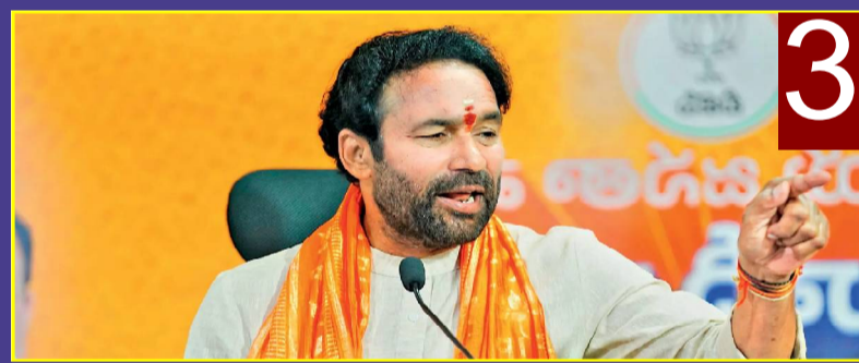
ట్రేడ్ డీల్స్పై కేంద్ర మంత్రి పీయాష్ గోయల్