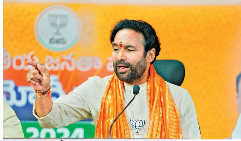
సీఎం రేవంత్ కు కిషన్ రెడ్డి వార్షింగ్

ముఖ్యమంత్రి రేవంత్ రెడ్డికి కేంద్ర మంత్రి కిషన్ రెడ్డి స్ట్రాంగ్ కౌంటరిచ్చారు. తమను విమర్శించే ముందు సీఎం రేవంత్ రెడ్డి ఒకసారి ఆత్మ విమర్శ చేసుకోవాలని హితవు పలికారు. హైదరాబాద్, ఫిబ్రవరి 7 : ముఖ్యమంత్రి రేవంత్ రెడ్డికి కేంద్ర మంత్రి కిషన్ రెడ్డి స్ట్రాంగ్ కౌంటరిచ్చారు. తమను విమర్శించే ముందు సీఎం రేవంత్ ఒకసారి ఆత్మ విమర్శ చేసుకోవాలని హితవు పలికారు. శనివారం ఏబీఎన్ ఆంధ్రజ్యోతిలో కిషన్ రెడ్డి మాట్లాడుతూ.. రేవంత్ తనను కల్గుకుంటున్న కిషన్ రావు అని విమర్శించారని.. తానెలా కల్గుకుంటున్న కిషన్ రావు అవుతాను? అని ప్రశ్నించారు. కేసీఆర్ కుటుంబాన్ని కాపాడాల్సిన అవసరం తనకు ఎందుకుంటుందని నిలదీశారు. పిచ్చి ప్రేలాపనలు చేయొద్దు.. పనికిరాని, పసలేని ఆరోపణలు చేయడం రేవంత్ రెడ్డికి బాగా అలవాటైందని కిషన్ రెడ్డి ఎద్దేవా చేశారు. రేవంత్ చెత్త విమర్శలకు తాను చాలాసార్లు కౌంటరిచ్చానని అన్నారు. మళ్ళీ మళ్ళీ ఆయన పిచ్చి ప్రేలాపనలు చేయొద్దని.. ఈ విషయాన్ని ఆయన విజ్ఞతకే వదిలేస్తున్నామన్నారు. కేంద్రంపై అనవసరంగా మాట్లాడితే ఊరుకోమని హెచ్చరించారు. మెదక్ పార్లమెంట్ నియోజకవర్గం నుంచి నాడు ఇందిరాగాంధీని గెలిపిస్తే.. ఆ జిల్లా ప్రజలకు, తెలంగాణకు ఆమె ఏం చేశారో ముఖ్యమంత్రి సమాధానం చెప్పాలని ప్రశ్నించారు. ప్రచారానికి పవన్ కల్యాణ్.? ప్రధానమంత్రి నరేంద్ర మోదీ అధికారంలోకి వచ్చాక దేశంలో అనేక అభివృద్ధి కార్యక్రమాలు జరిగాయని కిషన్ రెడ్డి వివరించారు. తమ ఎంపీలకు మోదీ సమ ప్రాధాన్యం ఇస్తారని స్పష్టం చేశారు. మున్సిపల్ ఎన్నికల ఫలితాల తర్వాత కేంద్రం తెలంగాణకు ఏం చేసిందో చెబుతామని తెలిపారు. ఈ ఎన్నికల ప్రచారానికి ఏపీ డిప్యూటీ సీఎం పవన్ కల్యాణ్ వచ్చే అంశంపై ఇంకా స్పష్టత రావాల్సి ఉందని కిషన్ రెడ్డి తెలిపారు.