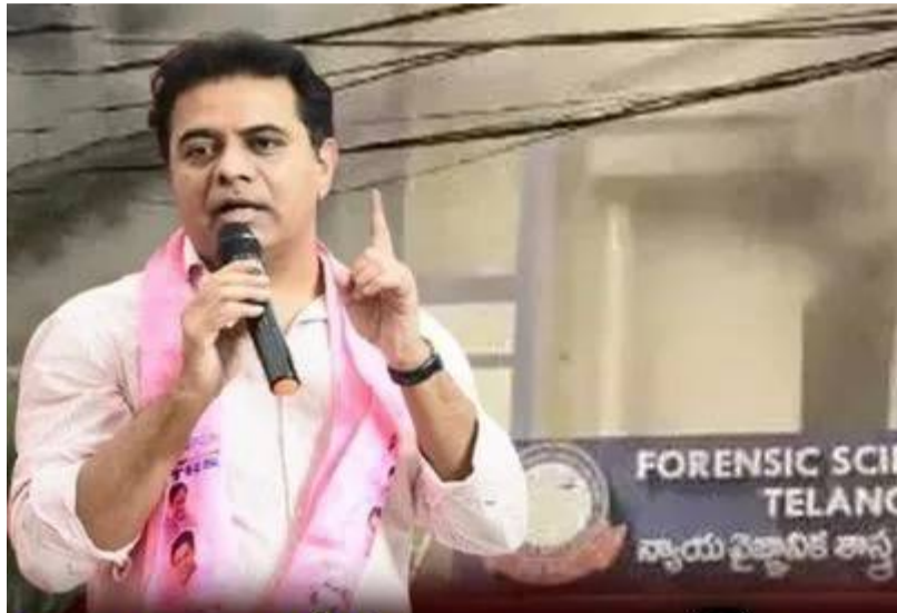
హనుమకొండ, ఫిబ్రవరి 08:

హైదరాబాద్ నాంపల్లిలోని ఫోరెన్సిక్ సైన్స్ లాబొరేటరీ (ఎఫ్ఎస్ఎల్) కార్యాలయంలో జరిగిన అగ్నిప్రమాదం ఘటనపై రిటైర్డ్ జడ్జితో విచారణ జరిపించాలని రాష్ట్ర ప్రభుత్వాన్ని బీఆర్ఎస్ కార్యనిర్వాహక అధ్యక్షుడు కేటీఆర్ డిమాండ్ చేశారు. రేవంత్ రెడ్డితో బీజేపీకి లాలూచీ లేకపోతే దర్యాప్తు చేయించాలని ప్రభుత్వానికి కేటీఆర్ సూటిగా సవాల్ విసిరారు. ఆదివారం