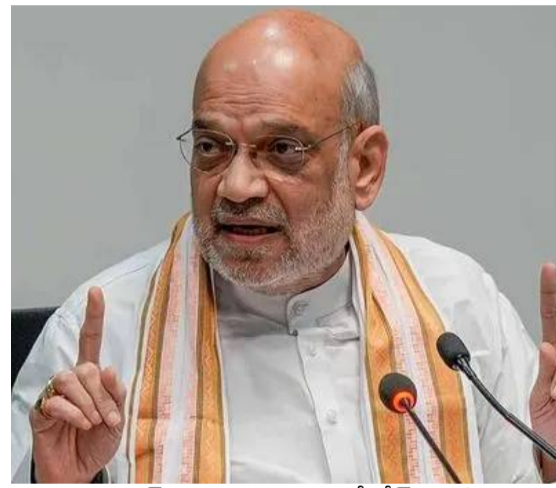
జరిపినట్టు అమిత్ షా తెలిపారు. సెక్యూరిటీ టీమ్లను ఏకం చేయడం, మౌలిక వసతుల విస్తరణ, మావోయిస్టుల ఆర్థిక నెట్వర్క్ ను దెబ్బతీయడం, లొంగుబాటు పాలసీలు వంటివి

నక్సల్ వ్యతిరేక ఆపరేషన్లపై ఛత్తీస్ గడ్ ప్రభుత్వం, అధికారులతో రాయ్ పూర్ లో అదివారంనాడు సమీక్షా సమావేశం జరిపినట్టు అమిత్ షా తెలిపారు. సెక్యూరిటీ టీమ్లను ఏకం చేయడం, మౌలిక వసతుల విస్తరణ, మావోయిస్టుల ఆర్థిక నెట్వర్క్ ను దెబ్బతీయడం, లొంగుబాటు పాలసీలు వంటివి నక్సలిజంపై పోరాటంలో సత్ఫలితాలను ఇచ్చినట్టు చెప్పారు. మార్చి 31 కల్లా నక్సలిజానికి చెల్లుచీటి : అమిత్ షా రాయ్ పూర్: వామపక్ష తీవ్రవాదంపై పోరాటంలో కేంద్రం చేపట్టిన వ్యూహం సత్ఫలితాలను ఇస్తోందని, ఈ ఏడాది మార్చి 31వ తేదీ నాటికి దేశంలో నక్సలిజాన్ని పూర్తిగా తుదముట్టిస్తామని కేంద్ర హోం మంత్రి అమిత్ షా (ఊపిత్ రాష్ట్రముష్ట్ర) తెలిపారు. మరి కొద్ది వారాల్లో కేంద్రం ప్రకటించిన గడువు ముగుస్తుండటంతో రాయ్ పూర్ లో అమిత్ షా ఉన్నత స్థాయి సమావేశం నిర్వహించారు. నక్సల్ వ్యతిరేక కార్యకలాపాలను సమీక్షించారు. అనంతరం ఆ వివరాలను సామాజిక మాధ్యమం 'ఎక్స్'లో ఆయన తెలియజేశారు. నక్సల్ వ్యతిరేక ఆపరేషన్లపై ఛత్తీస్ గడ్ ప్రభుత్వం, అధికారులతో రాయ్ పూర్ లో అదివారంనాడు సమీక్షా సమావేశం