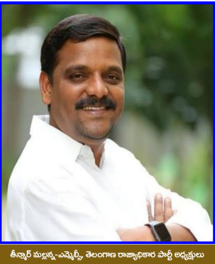
శ్రీనివాస మల్లం - ఎమ్మెల్యే, తెలంగాణ రాజ్యాంగ సంరక్షణ పార్టీ అధ్యక్షులు