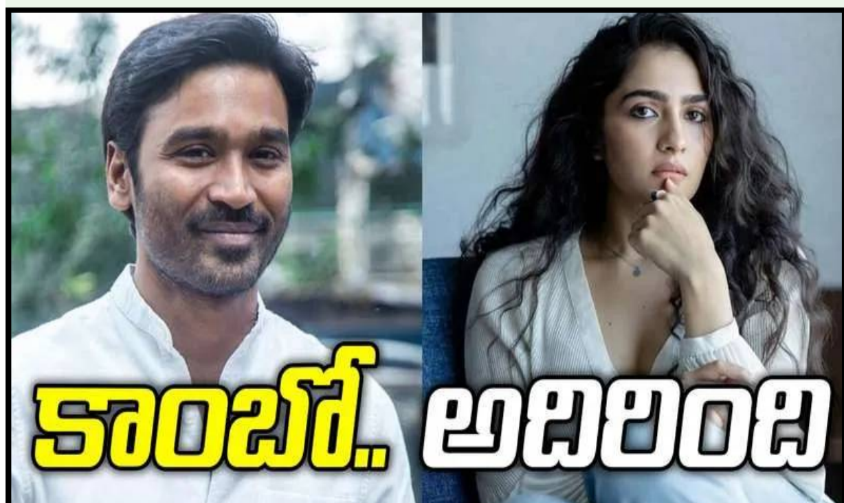
కాంబో.. అది అది