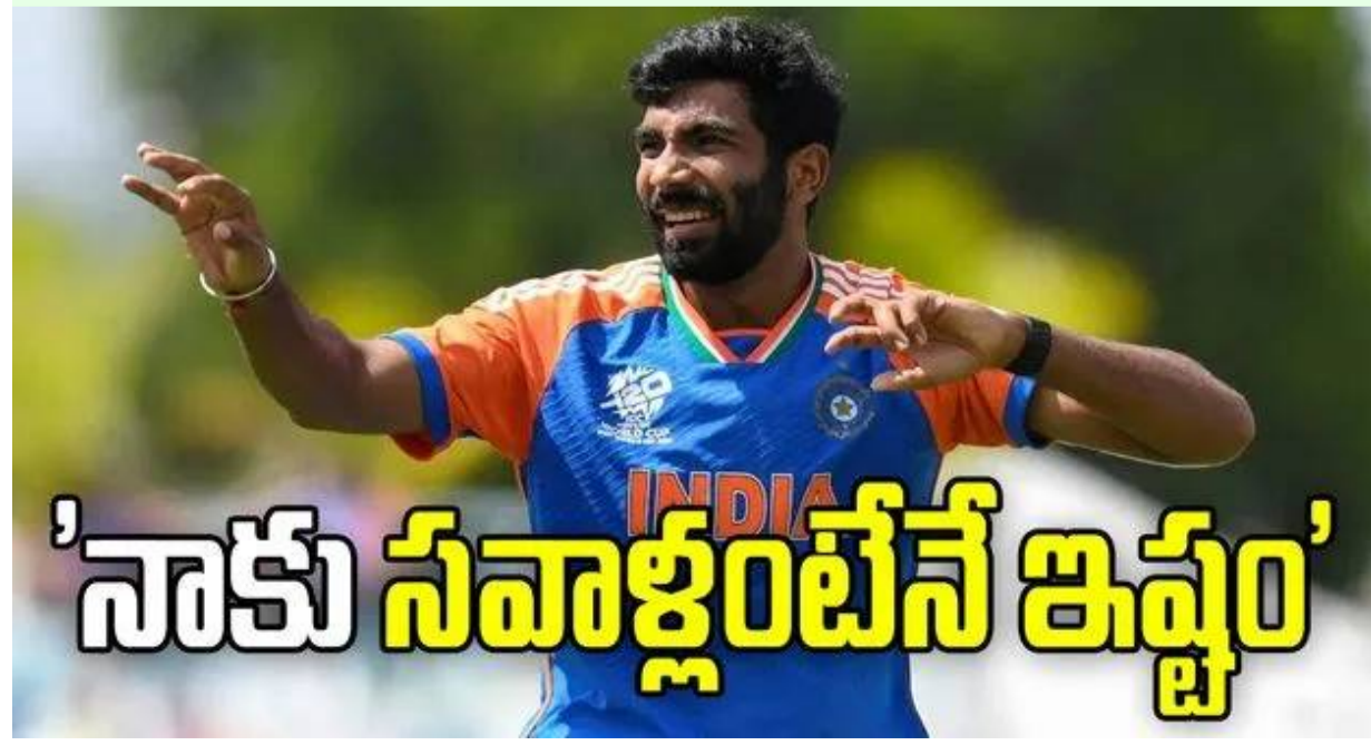
'నాకు సవాళ్లంటేనే ఇష్టం'