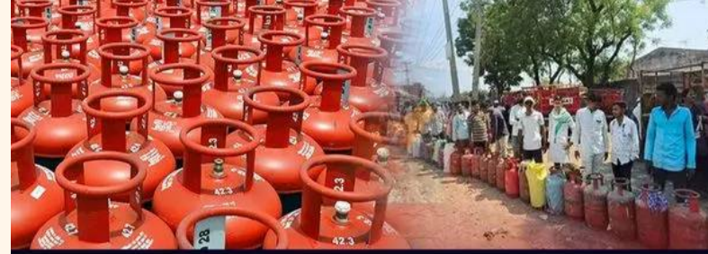
గ్యాస్ కోసం జనం బారులు

హైదరాబాద్: వంట గ్యాస్ కస్తాలు రోజురోజుకు ఎక్కువవుతున్నాయి. రానున్న రోజుల్లో సిలిండర్లు దొరకడం కష్టమంటూ సామాజిక మాధ్యమాల్లో వీడియోలు వైరల్ కావడంతో జనం గ్యాస్ సిలిండర్ కోసం ఏజెన్సీల వద్ద ప్రజలు బారులు తీరుతున్నారు. శుక్రవారం బోయిసపల్లి కేంద్రంలోని గ్యాస్ గోడౌన్ వద్ద వందలాది మంది వినియోగదారులు సిలిండర్ల కోసం క్యూలైన్లో నిల్చున్నారు. టీడీపీ కార్యకర్తల కుటుంబాలే లక్ష్యంగా రెచ్చిపోయిన వైసీపీ మూక గ్యాస్ కోసం జనం బారులు గ్యాస్ బుక్ చేసినా నివాసాల వద్దకు గ్యాస్ సిలిండర్లు రాకపోవడంతో వినియోగదారుల్లో ఆందోళన పెరిగిపోయింది. దీంతో సిలిండర్ల కోసం ఏజెన్సీల వద్దకు పరుగులు తీస్తున్నారు. శనివారం రంజాన్ పండుగ నేపథ్యంలో ముస్లింలు ఎక్కువగా గ్యాస్ గోడౌన్ వద్ద క్యూకట్టారు.