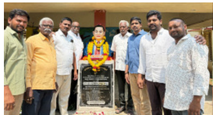
సందర్భంగా విగ్రహాలకు పూలమాలలు వేసి నివాళులర్పించారు.