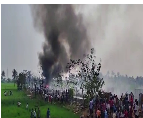
సమాచారం అందుకున్న పోలీసులు, అగ్నిమాపక సిబ్బంది అక్కడికి చేరుకుని సహాయక చర్యలు కొనసాగిస్తున్నారు. మంటలు అదుపులోకి తెవడం కష్టంగా మారింది. భారీ పేలుడు శబ్దాలు రావడంతో స్థానికులు భయాందోళనకు గురయ్యారు.