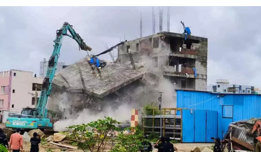
కలెక్టర్ అనుద్వీ దురిశెట్టితో ఈ విషయంపై చర్చించారు. తొలగించిన ఇళ్ల వారీగా సామాజిక, ఆర్థిక సర్వే చేపట్టి నివేదిక అందించాలని సీఎం ఆదేశించారు. అందులో అర్హులకు ఇంటిరమ్మ ఇళ్లు వెంటనే మంజూరు చేయాలని సూచించారు. ఇక భూదాన్ యజ్ఞ బోర్డు, రెవెన్యూశాఖ విచారణలో

ఖమ్మం : నగర శివారులోని వెలుగుమట్ల భూదాన్ భూముల వివరాల ప్రస్తుతం తెలంగాణలో హాట్ టాపిక్ మారింది. ఈనెల 24న రెవెన్యూ, మున్సిపల్ అధికారులు భారీ పోలీస్ బందోబస్తు మధ్య అక్కడి పేదల నిర్వాసితులను నేలమట్టం చేశారు. వందలాది ఇళ్లను జేసీబీలతో నేలమట్టం చేయడంతో పరిస్థితి ఉద్రిక్తంగా మారింది. అవి ప్రభుత్వ భూములని కొందరు రాజకీయ నాయకులు, దళారులు పేదల నుంచి దబ్బలు తీసుకొని అక్రమంగా ఈ స్థలాలును అంటగట్టారని అధికారులు ఆరోపిస్తున్నారు. ముందస్తు నోటీసులు ఇవ్వకుండా, కనీసం సామాన్య సర్దుకొవడానికి సమయం ఇవ్వకుండా కూల్చివేతలు చేపట్టారని బాధితులు రోదీలు అవుతున్నారు. వారికి అండగా ప్రతిపక్షాలు నిలుస్తున్నాయి. ప్రభుత్వంపై తీవ్ర స్థాయిలో ఫైరవుతున్నారు. ఈ నేపథ్యంలో వినోబాభావే నగర్ లో ఇళ్ల తొలగింపుతో గూడు కోల్పోయిన వారికి అండగా నిలిచేందుకు తెలంగాణ ప్రభుత్వం కనరత్న చేపట్టింది. ఈ మేరకు సీఎం రేవంత్, రెవెన్యూశాఖ మంత్రి పొంగులేటి శ్రీనివాసరెడ్డిలు జిల్లా