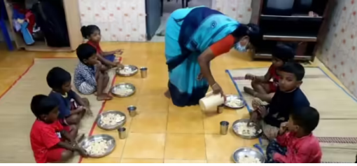
పథకాన్ని రాష్ట్రవ్యాప్తంగా అమలు చేసేందుకు ప్రతిపాదనలు రెడీ చేయాలని ఆధికారులను మంత్రి సీతక్క ఆదేశించారు. ఈనెల 20న తెలంగాణ బడ్జెట్ ప్రవేశ శుభాకాంక్షల సందర్భంలో శుక్రవారం (ఫిబ్రవరి 27) శిశు సంక్షేమ శాఖ కార్యాలయంలో ఆ శాఖ కార్యదర్శి అనితా రామచంద్రన్, కమిషనర్ శ్రుతి ఓజాతో కలిసి బడ్జెట్ కేటాయింపులు, అమలు లభిస్తున్న పథకాలు, ఖర్చులు,

హైదరాబాద్, ఫిబ్రవరి 28: తెలంగాణలోని అంగన్నాడి కేంద్రాలను బలోపేతం చేసేందుకు, చిన్నారులు, గర్భిణీలు, బాలింతలకు పౌష్టికాహారం అందించేందుకు ప్రభుత్వం కీలక చర్యలు తీసుకుంటుంది. ఇప్పటికే కొత్త పథకాలు అమలు చేస్తోంది. తాజాగా.. తెలంగాణను పోషకలోప రహిత రాష్ట్రంగా మార్చాలనే లక్ష్యంతో అంగన్నాడి బడుల్లో చదివే చిన్న పిల్లలకు క్రెక్ ఫాస్ట్ కార్యక్రమాన్ని అమలు చేసేందుకు రెడీ అవుతోంది. ఈ మేరకు తెలంగాణ శిశు సంక్షేమ శాఖ మంత్రి సీతక్క కీలక ప్రకటన చేశారు. త్వరలో ప్రయోగాత్మక ప్రాజెక్టు ప్రారంభించాలని యోచిస్తున్నట్లు చెప్పారు. ఆ తర్వాత కొత్త ఆర్థిక సంవత్సరం నుంచి తెలంగాణ వ్యాప్తంగా అమలు చేయాలని ఆధికారులను మంత్రి సీతక్క ఆదేశించారు. మారుమూల జిల్లాలు, పిన్కోడ్లలోని కొవ్వారి బాలింతల్లో రక్తహీనత తగ్గించేందుకు అదనపు పోషకాహార పథకాన్ని అమలు చేస్తున్నామని చెప్పారు. ఈ