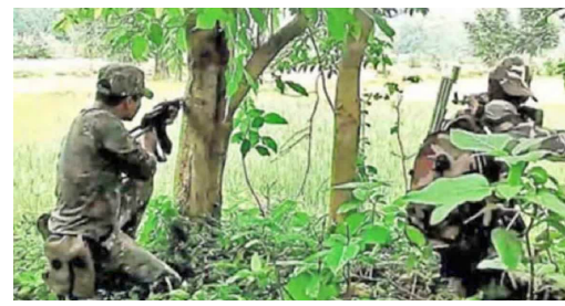
తెలుగుదేశం ప్రభుత్వం ఇచ్చినటువంటి సహకారంతో దాదాపు 700 ఎకరాల్లో శిక్షణ కేంద్రాన్ని ఏర్పాటు చేశారు. మావోయిస్టులు అడవుల్లో ఉండి ఏ విధంగా దాడులు చేస్తారో అలానే ఎదురు దాడులు చేసేవిధంగా కమాండోలకు శిక్షణ ఇచ్చారు. పోలీస్ శాఖలో కొత్తగా జాయిన్ అయిన వారిలో ఆసక్తి గల మెరికల్లాంటి

హైదరాబాద్, ఫిబ్రవరి 28: రాష్ట్రంలో మావోలే తరీని వెలుగుతున్నప్పుడు వారికోసమే పెట్టిన వ్యవస్థల అవసరం ఏముంటుందని ఇటీవల జరిగిన ఓ హైలెవల్ మీటింగ్లో ప్రభుత్వం ప్రశ్నించినట్లుగా సమాచారం. మరో పక్క వామపక్ష తీవ్రవాదంపై పోరాడేందుకు ఏర్పాటు చేసినటువంటి ప్రత్యేక విభాగాలను రద్దు చేయాలని కేంద్రం అన్ని రాష్ట్రాలకు లేఖలు రాసినట్లుగా తెలుస్తోంది. గ్రే హౌండ్స్ విభాగ రూపొందించిన వ్యాన్ : బంగాలోని నక్కల్ బరిలో వుట్టిన నక్కలైట్ ఉద్యమం ఉమ్మడి ఏపీలోని శ్రీకాకుళం ప్రవేశించి అసంతరం మిగతా ప్రాంతాలకు ముఖ్యంగా తెలంగాణకు విస్తరించింది. అసలీ కాలంలోనే ఈ ఉద్యమం ప్రభుత్వానికి నష్టాలు విసిరే స్థాయికి చేరింది. గెరిల్లా దాడులతో కంటిమీద కుసుకు లేకుండా చేస్తున్న వీరిని అదే తరహాలో ఎదుర్కోవాలన్న ఉద్దేశంతో అప్పటి ఐపీఎస్ అధికారి వ్యాన్స్ గ్రేహౌండ్స్ విభాగానికి రూపకల్పన చేశారు. నాటి