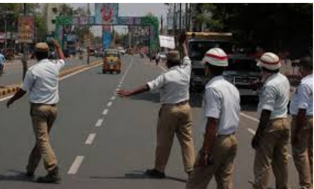
ట్రాఫిక్ మళ్లింపు చర్యలు చేపట్టారు. బంజారాహిల్స్ రోడ్ నెం. 1 నుంచి జూబ్లీహిల్స్ చెక్పోస్ట్ వైపు వెళ్లేవారు.. రోడ్ నెం. 10

హైదరాబాద్, ఫిబ్రవరి 28: నగరంలోని అత్యంత రద్దీ ప్రాంతమైన జూబ్లీహిల్స్, బంజారా హిల్స్ కూడళ్ల వద్ద ట్రాఫిక్ కష్టాలకు శాశ్వత పరిష్కారం చూపే దిశగా తెలంగాణ ప్రభుత్వం ఆడుగులు వేస్తోంది. కేబీఆర్ పార్క్ చుట్టూ ప్రతిష్టాత్మకంగా చేపట్టనున్న ఏడు ఫ్లైఓవర్లు, ఏడు అందర్ పాసుల నిర్మాణ పనులకు ఈ క్రమంలో ముగ్గా జంక్షన్ వద్ద భూమి వూజ నిర్వహించారు. ఈ భారీ నిర్మాణ పనుల నేపథ్యంలో (శనివారం) నుంచి ఆ పరిసర ప్రాంతాల్లో ట్రాఫిక్ ఆంక్షలు (ఓటోలుఅండ్ తీవర్లతోఅతీఅం) అమలులోకి వచ్చాయి. ఇప్పటికే వాహనదారులకు పలు సూచనలు చేశారు ట్రాఫిక్ పోలీసులు. ముఖ్యమైన ట్రాఫిక్ మళ్లింపులు ఇవే. భారీ మౌలిక సదుపాయాల కల్పన జరుగుతున్న సమయంలో సామాన్య ప్రజలకు, వాహనదారులకు ఇబ్బంది కలగకుండా ట్రాఫిక్ పోలీసులు పకడ్బందీ ప్రణాళికను సిద్ధం చేశారు. ముఖ్యంగా సాగర్ సాసెటి, జూబ్లీహిల్స్ చెక్పోస్ట్, కేబీఆర్ పార్క్ ఎంట్రన్స్ (గేట్-1), ముగ్గా జంక్షన్ మార్గాల్లో