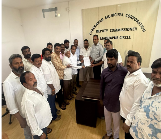
మన మహాత్మి న్యూస్ ప్రతినిధి నారాయణపేట జిల్లా మక్తల్ నియోజకవర్గం... ఉమ్మడి మహబూబ్ నగర్ నారాయణపేట జిల్లా మక్తల్ నియోజకవర్గం జనసేన పార్టీ కార్యాలయం లో మక్తల్ నియోజకవర్గ పి. ఓ. సి. తెలంగాణ జనసేన పార్టీ రాష్ట్రయజమాన