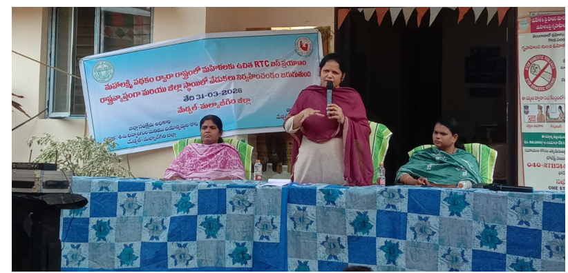
మేడల్ మలాజిగి జిల్లా మహాత్మి న్యూస్ మార్చి 31 ప్రతినిధి:- మహిళ అర్టీసీ బస్సు ఉచిత ప్రయాణం మహా లక్ష్మి పథకం మొదటి వార్షిక సంవత్సరం పూర్తి చేసుకోవడంలో బాగంగా రాష్ట్ర మరియు జిల్లా స్థాయిలో విజయోత్సవ సంబరాలను నిర్వహించడం జరిగింది. ఈ మహా లక్ష్మి పథకం పథకం ద్వారా ఇప్పటి వరకు 290.27 కోట్ల మహిళా ప్రయాణికులు లబ్ధి పొందారు. ఈ కార్యక్రమంలో బాగంగా, మేడల్ మలాజిగి జిల్లాలోని ఆల్పాల్ సఖి సెంటర్ నందు జిల్లా స్థాయి వేడుకలను