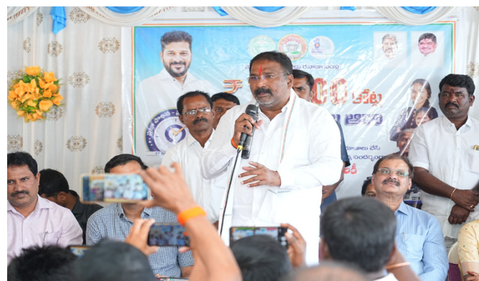
అవహేళన గా మాట్లాడుతున్నాయని ఇది నరైన పద్ధతి కాదన్నారు. ఉచిత బస్సు ప్రయాణం వల్ల మహిళలు చాలా డబ్బు ఆదా చేసుకున్నారుని మంత్రి తెలియజేశారు.నిజం గడప దాటక ముందే అబద్ధం ఊరు తిరిగి వస్తుందని ప్రతిపక్షాలనుద్దేశించి ఎద్దేవా చేశారు.ఇందిన నడిపే శక్తి ఉన్న మహిళలు దేన్నైనా సాధించగలరని మంత్రి ఆశాభావం వ్యక్తం చేశారు. కోటి మంది