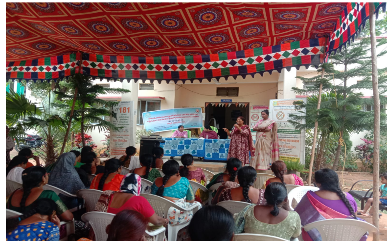
నిర్వహించడం జరిగింది. ఈ వేడుకలకు మహిళా ప్రయాణికులను, సెల్ఫ్ హెల్ప్ గ్రూప్స్ మరియు సమాఖ్య లీడర్స్ ని ఆహ్వానించడం జరిగింది. ఈ కార్యక్రమంలో మహిళా ప్రయాణికులు, సెల్ఫ్ హెల్ప్ గ్రూప్స్, సామాజ్య లీడర్స్, పాల్గొని వారి యొక్క అనుభవాలను మరియు ఉచిత ప్రయాణం ద్వారా పొందుతున్న లబ్ధిని వివరించడం జరిగింది. ఈ కార్యక్రమంలో

మహిళా, శిశు, దివ్యాంగుల డి వయాపర్షు సంక్షేమ శాఖ అధికారి , సీడీపీఓ. లు, సూపర్ వైజర్స్, సఖి స్టాఫ్, డి డోవలేయ్ ఆఫీస్ స్టాఫ్, డీసీపీ యు స్టాఫ్, మరియు ఇతర సిబ్బంది పాల్గొనడం జరిగింది.,