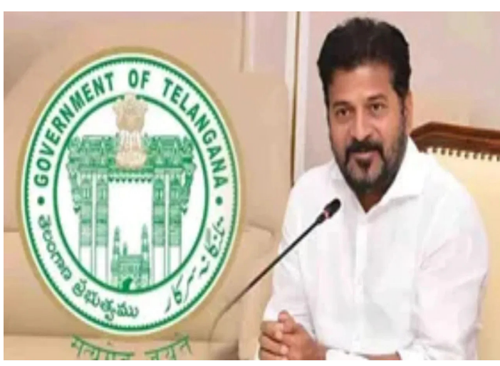
ఉంటుంది. మురుగు కాల్వల మరమ్మత్తులు, రోడ్ల నిర్మాణం, వీధి దీపాలు ఏర్పాటు, శుసాన వాటికల నిర్మాణం వంటి పనులకు వేగం పుంజుకుంది.

హైదరాబాద్ : తెలంగాణకు కేంద్ర ప్రభుత్వం భారీ గుడ్ న్యూస్ అందించింది. రాష్ట్రంలోని గ్రామాలకు ప్రత్యేక గ్రాంట్లు విడుదల చేస్తూ నిర్ణయం తీసుకుంది. ఈ మేరకు 15వ ఆర్థిక సంఘం సిఫార్సుల మేరకు ఆరు రాష్ట్రాలకు కేంద్రం రూ.1500 కోట్లకుపైగా గ్రాంట్లు రిలీజ్ చేసింది. ఇందులో తెలంగాణలోని పంచాయతీ రాజ్ సంస్థలకు రూ.247.94 కోట్ల అన్ బైట్ గ్రాంట్స్ కేటాయించారు. ఈ నిధులు రాష్ట్రంలోని గ్రామ పంచాయతీలకు ఉపయోగించనున్నారు. గ్రామాల్లో రోడ్లు, నీళ్లు, విద్యుత్, పారిశుధ్యం లాంటి మౌలిక సదుపాయాలు ఆ నిధులతో కల్పించనున్నారు. రాష్ట్రంలోని 12600 గ్రామ పంచాయతీలకు వీటిని వినియోగించనున్నారు. కేంద్రం కొత్త నిబంధనఉద్దేశ్యాల జీతాలకు కాకుండా పంచాయతీల్లో అభివృద్ధి పనులకు మాత్రమే ఈ నిధులు ఉపయోగించాలని కేంద్రం నిబంధన విధించింది. ఆ నిధులతో గ్రామాల్లో అభివృద్ధి పనులు పరుగులు పెట్టుతున్నాయి. గ్రాంట్లు విడుదలకు సంబంధించి కేంద్ర పంచాయతీ రాజ్ శాఖ ఉత్తర్వులు జారీ చేసింది. 2025-26 ఆర్థిక సంవత్సరానికి సంబంధించి తొలి విడత గ్రాంట్లను ఇప్పుడు విడుదల చేసింది. ఈ గ్రాంట్లను గ్రామ సభ ఆమోదంతో ఖర్చు చేయాలి