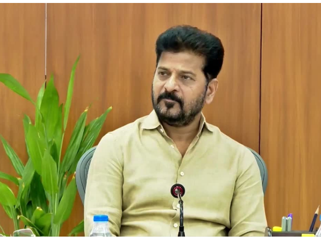
భాగంగా, 4 డ్రోన్లతో దాడి చేసినట్లు టెహ్రాన్ వెల్లడించింది. సంద్రంపై ఇరాన్, గల్ఫ్ ప్రాంతాల్లో ఉన్న తెలుగు ప్రజలందరూ అప్రమత్తంగా ఉండాలన్న సీఎం రేవంత్ అయో దేశాల్లోని భారత ఉండాలని ముఖ్యమంత్రి ఆకాంక్షించారు.

హైదరాబాద్ పశ్చిమాసియా దేశాల్లో నెలకొన్న ఉద్రిక్త పరిస్థితుల్లో ఇరాన్, ఇజ్రాయెల్ ప్రాంతాల్లో ఉన్న తెలుగు ప్రజలందరూ అప్రమత్తంగా ఉండాలని సీఎం రేవంత్ రెడ్డి ఆకాంక్షించారు. భద్రతా మార్గదర్శకాలను పాటించాలని అక్కడి తెలుగు ప్రజలను కోరారు. ప్రతి ఒక్కరూ సురక్షితంగా ఉండాలి : అయో దేశాల్లోని భారత రాయబార కార్యాలయాలు జారీ చేసే సూచనలు పాటించాలని రేవంత్ రెడ్డి తెలిపారు. అత్యవసర పరిస్థితి ఎదురైతే తప్ప తెలుగు ప్రజలు ఎవరూ బయటకు రావద్దని సూచించారు. తెలుగువారిని రప్పించేందుకు కేంద్రంతో రాష్ట్రం సమన్వయం చేసుకుంటుందన్న ఆయన ఇరాన్, గల్ఫ్ దేశాల్లోని రాష్ట్రప్రజల పరిస్థితిని ప్రభుత్వం నిరంతరం పరిశీలిస్తుందని పేర్కొన్నారు. ఇరాన్ సుప్రీం లీడర్ ఖమేనీ మృతి చెందిన నేపథ్యంలో అదేశం ప్రతీకార దాడులకు దిగింది. తాజాగా పశ్చిమాసియాలోని 27 అమెరికా సైనిక స్థావరాలే లక్ష్యంగా డ్రోన్లు, క్షిప్రణులతో దాడులు చేస్తోంది. వీటిలో ఇజ్రాయెల్లోని బెల్ నోఫ్ ఎయిర్ బేస్, ఇజ్రాయెల్ ఆర్మీ ప్రధాన కార్యాలయం హాతియాలోపాటు రక్షణ రంగ ఫ్యాక్టరీలు కూడా ఉండడం గమనార్హం. అంతేకాదు అమెరికా నౌకలకు మందుగుండు సరఫరా చేసే ఎంఎస్పీ షిప్పై 'అవరేషన్ ట్రూ ప్రామిస్'లో