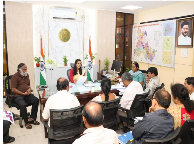
సంగారెడ్డి, మార్చి 02. మన మహతి న్యూస్ :

నిమ్మ లో మౌలిక వసతులు కల్పించే ఎస్ఆర్ఆర్ కస్టోడియన్ కంపెనీకి ఇప్పటివరకు సేకరించిన భూములను అప్పగించాలని కలెక్టర్ సూచించారు. అప్పుట్ అభివృద్ధి చేసేందుకు వీలుగా పది రోజుల్లో సర్వే పూర్తి చేయాలన్నారు. లె