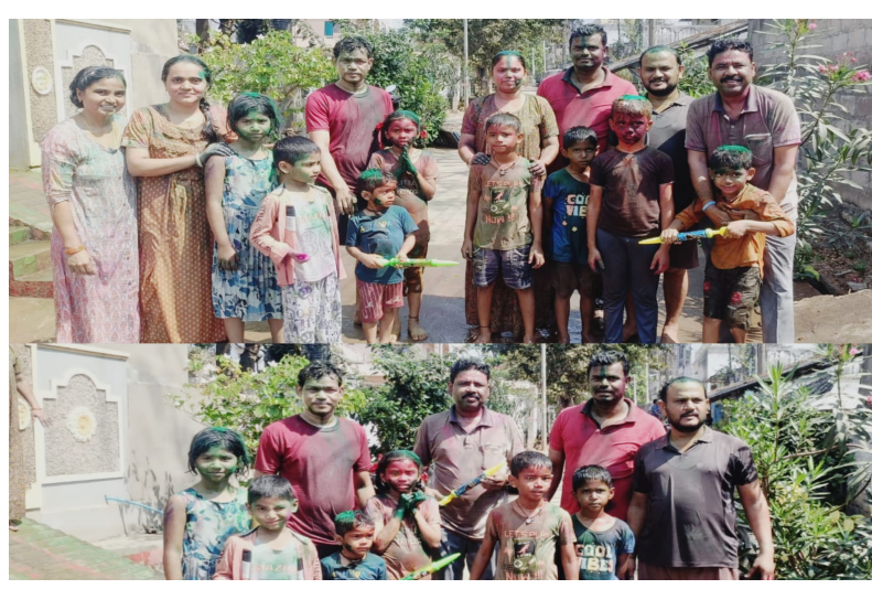
మన మహతి న్యూస్ లక్ష్మీదేవి పల్లి లక్ష్మీదేవిపల్లి మండలం లక్ష్మీ పల్లి గ్రామపంచాయతీలో హోలీ వేడుకలు అంబరాస్తుంటాయి. కులమతాలకు అతీతంగా ప్రజలంతా ఏకమై రంగుల పండుగను ఘనంగా జరుపుకున్నారు. చిన్నారులు వీధుల్లోకి చేరి ఒకరిపై ఒకరు రంగులు చల్లుకుంటూ సందడి చేశారు. ఈ వేడుకల్లో స్థానిక మహిళలు, పెద్దలు, ఉద్యోగులు వరసపూరి ఆస్వాదనంగా రంగులు చల్లుకుంటూ సోదరభావాన్ని ప్రదర్శించారు. ఈ రంగుల పండుగ అందరి జీవితాల్లో సుఖసంతోషాలు, కొత్త ఆశలు నింపాలని గ్రామస్థులు ఆకాంక్షించారు.