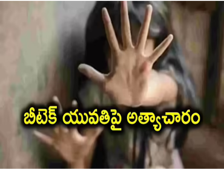
బీటెక్ యువతిపై అత్యాచారం