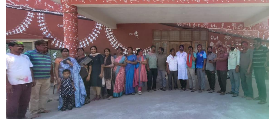
కోరుకుంటూ హోలీ అనేది బుక్కత, ప్రేమ, సోదరభావానికి ప్రతీక అని ఆయన అన్నారు. అందరూ కలిసికట్టుగా ఆనందంతో జరిగింది. సహకరించిన ప్రతి ఒక్కరికి పేరుపేరునా కృతజ్ఞతలు తెలుపుతున్న బంజారా వెల్ఫేర్ కమిటీ సభ్యులు