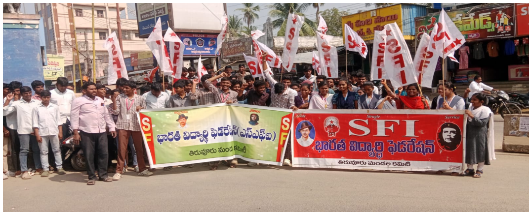
కొంతమంది పైన కేసు నమోదు చేశారు. అయినా వారిని నేటి వరకు అరెస్టు చేయకపోవడంతో విద్యార్థులు ఆందోళన చేపట్టారు. మోహన్ బాబును అతని వర్సిటీ యలను వెంటనే అరెస్ట్ చేసి విద్యార్థుల నుండి అదనంగా వసూలు చేసిన ఫీజులను చెల్లించాలని బోసు బొమ్మ సెంటర్లో జరిగిన ఆందోళనలో విద్యార్థులు నినాదాలు చేశారు.