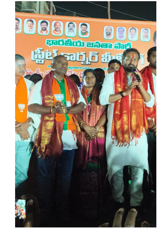
గెలిపించాల్సిందే అని ప్రజలకు పిలుపునిచ్చారు. ప్రజలంతా ఒక్కటై బీజేపీకి మద్దతు తెలపాలని ఆయన విజ్ఞప్తి చేశారు.