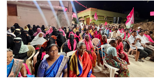
ప్రజలను కోరారు. గత బిఆర్ఎస్ ప్రభుత్వ హయాంలో రూ.900