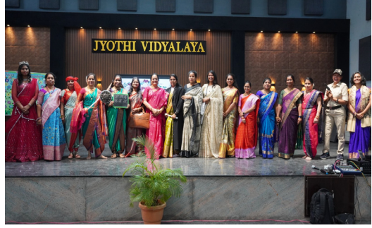
శేరిలింగంపల్లి మన మహాత్తి న్యూస్ మార్గ్ 6 అంతర్జాతీయ మహిళా దినోత్సవం సందర్భంగా బి హెచ్ ఇ ఎల్ టాన్ షిమ్ లోని జ్యోతి విద్యాలయంలో వేడుకలు ఘనంగా నిర్వహించారు. వివిధ వేషధారణలతో టీచర్లు అలరించారు. మహిళలు పోషించే ఉపాధ్యాయురాలు పాల్గొన్నారు.