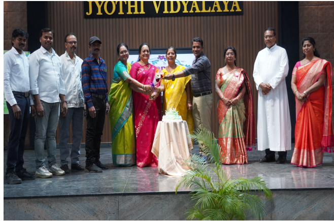
విద్యాలయంలో వేడుకలు ఘనంగా నిర్వహించారు. వివిధ వేషధారణలతో టీచర్లు అలరించారు. మహిళలు పోషించే ఉపాధ్యాయురాలు పాల్గొన్నారు.