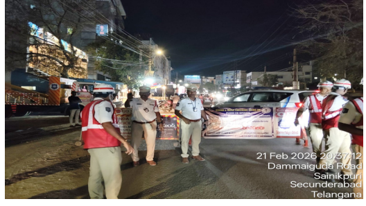
మన మహాత్తి న్యూస్ మేడ్చల్ కుల్యాణి జిల్లా జవహర్ నగర్, మార్చి 6: మద్యం సేవించి వాహనాలు నడుపుతూ ఇతరుల ప్రాణాలకు ముప్పు కలిగిస్తున్న వారిపై న్యాయస్థానం కఠినంగా