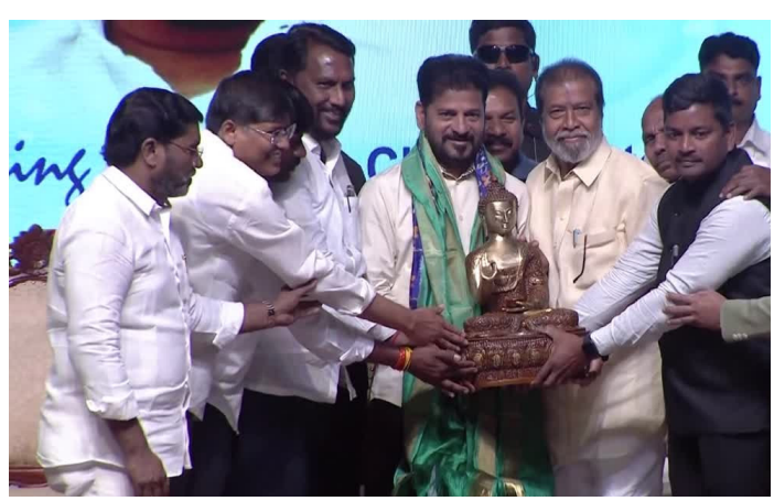
వర్గీకరణ సమస్య ఉందన్నారు. మీ న్యాయమైన హక్కు కోసం...