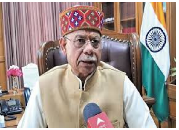
శుక్లా. న్యాయశాస్త్రంలో డిగ్రీ పట్టా పొందారు. బీజేపీ విద్యార్థి విభాగం...

హైదరాబాద్: తెలంగాణ కొత్త గవర్నర్ శివప్రతాప్ శుక్లా నియమితులయ్యారు.