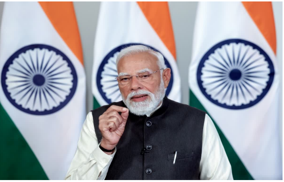
భారత్-అమెరికా మధ్య వరసర ప్రయోజనకరమైన వాణిజ్య భాగస్వామ్యాన్ని సాకారం చేస్తుందని విదేశాంగమంత్రి జైశంకర్ షిన్డేచేశారు. మన ఎగుమతిదారులకు ఛారి మార్కెట్ యాక్సెస్ కల్పించి అవకాశాలను సృష్టిస్తుందన్నారు. మేకిన్ ఇండియాను మరింత బలోపేతం చేసే కొత్త మార్గాలు తెరుచుకున్నాయని జైశంకర్ వివరించారు.

న్యూ ఢిల్లీ : భారత్- అమెరికా మధ్యంతర వాణిజ్య ఒప్పందంపై ప్రధాన మంత్రి నరేంద్ర మోదీ స్పందించారు. ఇది ఇరుదేశాలకు గుడ్ న్యూస్ అని అన్నారు. ఈ ఒప్పందం భారత్-అమెరికా మధ్య బలమైన భాగస్వామ్యం, పెరుగుతున్న విశ్వాసం, చైతన్యాన్ని ప్రతిబింబిస్తుందని అన్నారు. ఇరుదేశాల మధ్య సంబంధాల బలోపేతానికి వ్యక్తిగతంగా కృషిచేసిన అమెరికా అధ్యక్షుడు ట్రంప్ నకు ప్రధాని మోదీ ధన్యవాదాలు తెలిపారు. ఈ మేరకు ఎక్స్ ప్రెస్ చేశారు. భారత్-అమెరికా వాణిజ్య ఒప్పందం భారతీయ రైతులు, పారిశ్రామికవేత్తలు, ఎంఎస్ఎంఈలు, స్టార్టప్ ఆవిష్కర్తలు, మత్స్యకారులకు కొత్త అవకాశాలను సృష్టిస్తుందని ప్రధాని మోదీ తెలిపారు. దీని వల్ల మేకిన్ ఇండియా సలకారాన్ని బలోపేతం చేస్తుందని వివరించారు. మహిళలు, యువతకు పెట్టే ఎత్తున ఉపాధి కల్పిస్తుందన్నారు. ఇరు దేశాల మధ్య పెట్టుబడులు, సాంకేతికతల భాగస్వామ్యం పెరుగుతుందని ప్రధాని వెల్లడించారు. సరఫరా గొలుసుల్ని బలోపేతం చేసి ప్రపంచ వృద్ధికి దోహదం చేస్తుందని రాసుకొచ్చారు. వికసిత భారత్ దిశగా ముందుకు సాగుతున్న ఈ తరుణంలో భవిష్యత్ ఆధారిత ప్రపంచ భాగస్వామ్యాన్ని నిర్మించేందుకు కట్టుబడి ఉన్నట్లు మోదీ పేర్కొన్నారు. మేకిన్ ఇండియాను మరింత బలోపేతం ఈ ఒప్పందం