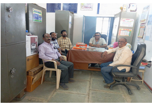
హనుమకొండ జిల్లా ఫిబ్రవరి 7 స్వస్ జిల్లా పర్యవేక్షణ లో భాగంగా ఈ రోజు ముచ్చర్ల పి ఎస్ డైట్ టీమ్ 2 హాసనపల్లి మండలం ముచ్చర్ల ప్రాథమిక పాఠశాల ను