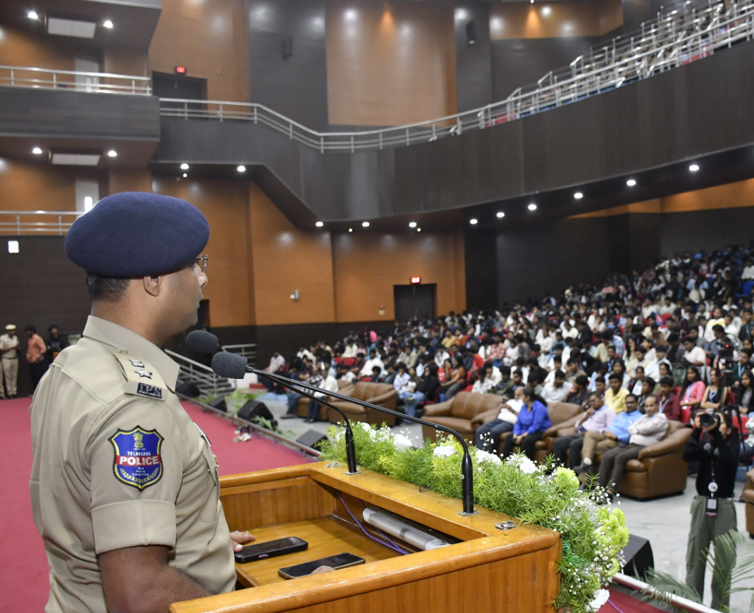
డిజిటల్ అరెస్ట్ అంటే ఎవ్వరూ బయపడాలిని అప్రయం లేదని, ఎవరైనా సైబర్ నేరాలకు గురి అయినట్లైతే వెంటనే (గోల్డెన్ అవర్)/48 గంటలలోపు 1930 కు కాల్ చేసి గాని, ) పోలీస్ సందు కాంప్లయింట్ నమోదు చేయాలని ఎస్సీ గార్లు లింక్స్, ఖజానా ఫిల్స్ ఓపెన్ చేసి మోసపోవద్దని అన్నారు. సూచించారు.