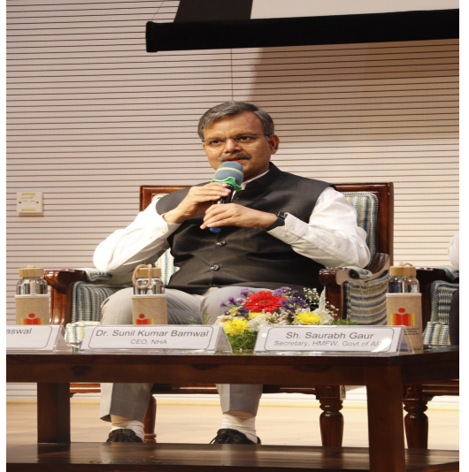
సంగారెడ్డి, మార్చి 07, మన మహాత్మి న్యూస్ :