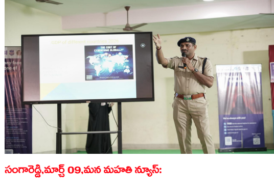
సంగారెడ్డి, మార్చి 09, మన మహాత్మి న్యూస్: