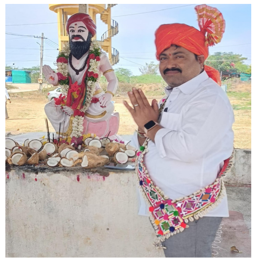
లేకుండా చేసే ప్రయత్నం చేస్తున్నారు. కాబట్టి తెలంగాణ రాష్ట్ర బంజారా రాజకీయ నాయకులు ఉద్యోగస్తులు మేధావులు

మన మహతి న్యూస్ పరంగల్ జిల్లా ఫిబ్రవరి 10 పరంగల్ జిల్లాలోని రంగశాపేట్ లో ఎంతో భక్తి శ్రద్ధలతో నిర్వహించుకున్న బంజారా జాతి ఆరాధ్య దైవమైన సంత సేవాలాల్ మహారాజ్ విగ్రహానికి దొంగతనంగా తొలగించిన విషయంలో ఆలోచిస్తూ ఈ దేశంలో బంజారాలు ఇంకా ఎన్ని సంవత్సరాలు ఇలా అణిచివేతకు గురి కావాలి. సేవాలాల్ మహారాజ్ విగ్రహాని తొలిగించి సభ్యసమాజంలో మా బంజారా జాతి మనోభావాలను దెబ్బతీసి మతాల మధ్య చిచ్చు పెట్టాలని చూసిన వారిపై తక్షణమే చట్టరీత్యా చర్యలు తీసుకొని మా ఆరాధ్య దైవమైన సంత సేవాలాల్ మహారాజ్ విగ్రహానికి అప్పచెప్పకపోతే రేపు జరగబోయే పరిణామాలు తీవ్రంగా ఉంటాయి అని హెచ్చరిస్తున్నాం. మా జాతిని ఈ తెలంగాణ రాష్ట్రంలో చాలా చోట్ల చాలా విధాలుగా ఇబ్బందులకి గురి అవుతున్న రాష్ట్రం ప్రభుత్వం మాత్రం ఎలాంటి చర్యలు తీసుకోవడం లేదు. ఇప్పటికైనా మా యావత్ బంజారా జాతికి ఒకటి చెపుతున్న మన హక్కులను మనకు ఎవరు అమర్చి ఇవ్వరు కాబట్టి జరిగిన ఈ రంగశాపేట్ సంఘటనని దృష్టిలో పెట్టుకొని మనం మన హక్కులను కొట్లాడి తీసుకోవాలి లేకపోతే ఈరోజు మన దేవుడికి దిక్కులేదు రేపటి రోజు మనకు కానీ మన జాతిని కానీ ఉనికి