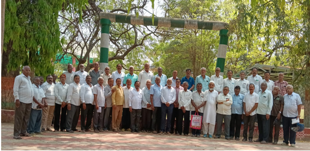
మరియు ప్రభుత్వం నుంచి వస్తున్న రాయితీలను ఉపయోగించుకోవాలని సలహా ఇచ్చారు.