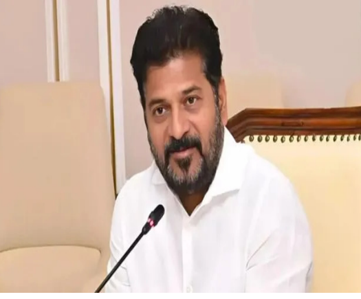
రింగ్ రోడ్లు నిర్మించి, వాటిని జాతీయ రహదారులతో

హైదరాబాద్, మార్చి 11: తెలంగాణ రాష్ట్ర రూపురేఖలను మార్చే విధంగా, భవిష్యత్తు అవసరాలకు అనుగుణంగా రహదారులు, వైద్య రంగాల్లో భారీ మార్పులకు సీఎం రేవంత్ రెడ్డి తీవ్రంగా చుట్టారు. అధికారులతో నిర్వహించిన సమీక్షా సమావేశంలో 'రోడ్ సెక్టార్ పాలసీ-2047' లక్ష్యంగా కీలక ఆదేశాలు జారీ చేశారు. రాష్ట్రంలో రహదారుల వ్యవస్థను అంతర్జాతీయ ప్రమాణాలకు అనుగుణంగా తీర్చిదిద్దాలని సీఎం రేవంత్ రెడ్డి స్పష్టం చేశారు. హైదరాబాద్ నగరం నుంచి రాష్ట్రంలోని ఏ ప్రాంతానికైనా నిర్ణీత సమయంలో చేరుకునేలా రోడ్ల నెట్ వర్క్ ను అభివృద్ధి చేయాలని అన్నారు. నగరంలో పెరుగుతున్న వాహనాల సంఖ్యతో వీపీసీలను ప్రాథమిక జాతి ఏర్పడటంతో, ప్రాథమిక కష్టాల నుంచి విముక్తి చేయడానికి కనెక్టివిటీ రోడ్ల నిర్మాణానికి ప్రాధాన్యత ఇవ్వాలని ఆదేశించారు. ఇప్పటికే గుర్తించిన ప్రాంతాలలో పనులను తక్షణమే ప్రారంభించాలని అధికారులకు సూచించారు. రాష్ట్రంలోని ప్రధాన జిల్లా కేంద్రాలన్నింటికీ ఒక