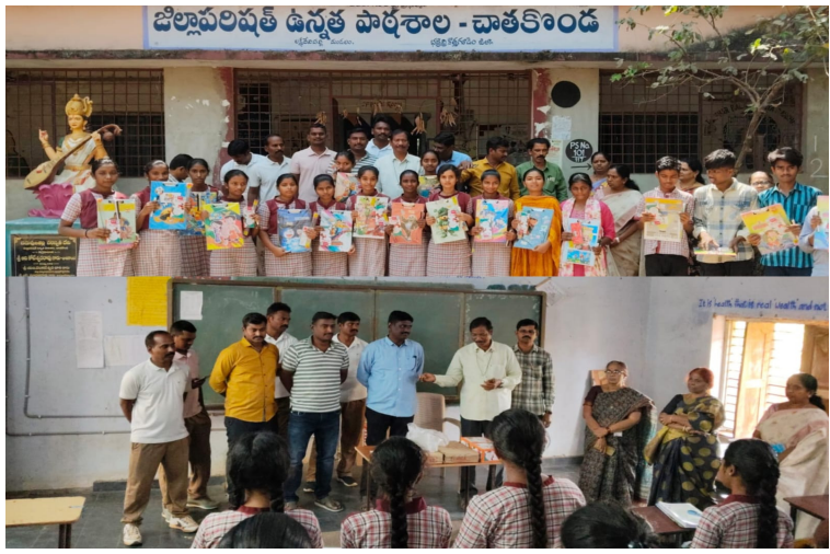
మన మహతి న్యూస్ లక్ష్యదేవ పల్లి

- రక్షణలోనే కాదు సేవా కార్యక్రమాలలో 6వ బెటాలియన్ పోలీస్ టీం