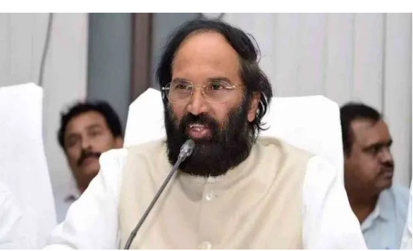
దేశవ్యాప్తంగా గ్యాస్, చమురుకు తీవ్ర కొరత ఏర్పడింది. గ్యాస్ సిలిండర్లకు ఎలాంటి కొరత లేదని కేంద్రం వెలుతున్నప్పటికీ.. వాస్తవ పరిస్థితి మాత్రం పూర్తి భిన్నంగా ఉంది. తెలంగాణలో వంట గ్యాస్ సిలిండర్ల సరఫరాకు ఇబ్బందులు ఏర్పడ్డాయి. దాంతో హోటళ్లు, హాస్టళ్లు, మెన్లకు అవసరమైన మేర కమర్షియల్ సిలిండర్ల సరఫరా తేలికపాటిగా ఉండేలా చాలా ప్రాంతాల్లో అవి మూతపడ్డాయి. ఈ నేపథ్యంలో గ్యాస్ సిలిండర్ల కొరత నివారణకు రాష్ట్ర ప్రభుత్వం ప్రత్యేక చర్యలు చేపట్టింది. అందుకోసం శుక్రవారం వివిధ శాఖల ఉన్నతాధికారులతో పౌర సరఫరాల శాఖ మంత్రి ఉత్తమ్ కుమార్ రెడ్డి సమీక్ష నిర్వహించనున్నారు.

హైదరాబాద్, మార్చి 12: తెలంగాణలో కమర్షియల్ సిలిండర్ల కొరత వాస్తవమేనని రాష్ట్ర పౌర సరఫరా శాఖ మంత్రి ఉత్తమ్ కుమార్ రెడ్డి స్పష్టం చేశారు. గురువారం హైదరాబాద్ లో మంత్రి ఉత్తమ్ కుమార్ రెడ్డి విలేజ్ లో మాట్లాడుతూ.. రాష్ట్రంలో నిత్యం సరఫరా అవుతున్న వంట గ్యాస్ సిలిండర్లలో దాదాపు 86 శాతం డొమెస్టిక్ కనెక్షన్లనే ఆయన స్పష్టం చేశారు. అలాగే మిగిలిన 14 శాతం మాత్రమే కమర్షియల్ అని వివరించారు. ప్రస్తుతానికి డొమెస్టిక్ సిలిండర్ల సరఫరాలో ఎలాంటి కొరత లేదని తమ శాఖ అధికారులు వెల్లడించారని చెప్పారు. కానీ కమర్షియల్ సిలిండర్ల సరఫరాలో మాత్రం కొన్ని ఇబ్బందులు ఉన్నాయని వాస్తవం తెలిపారు. రాష్ట్రంలో వంట గ్యాస్ కొరత పరిస్థితి పై చర్చించేందుకే ప్రభుత్వ ప్రధాన కార్యదర్శి, పౌర సరఫరా శాఖ ఉన్నతాధికారులు, చమురు కంపెనీల ప్రతినిధులతో శుక్రవారం సమీక్షిస్తామని మంత్రి ఉత్తమ్ వివరించారు. రాష్ట్రంలో రోజూ ఎన్ని కమర్షియల్ సిలిండర్లు అవసరం.. సరఫరా ఏ మేరకు ఉంది. గ్యాస్ కొరతకు గల కారణాలు, అందుకు అధిగమించేందుకు తీసుకోవాల్సిన చర్యలతోపాటు ప్రత్యామ్నాయాలపై దృష్టి పెట్టేందుకున్న మార్గాలపై చర్చించనున్నట్లు మంత్రి ఉత్తమ్ వివరించారు. అలాగే పూర్తి వివరాలతో రావాలని ఆయన కంపెనీల ప్రతినిధులతోపాటు అధికారులకు సమాచారం ఇచ్చామన్నారు. పరిస్థితి చేయి దాటి పోకుండా ఉండేందుకు ఎప్పటికప్పుడు పరిస్థితిని పర్యవేక్షిస్తున్నట్లు మంత్రి ఉత్తమ్ వెల్లడించారు. మరో వైపు.. ఇరాన్, ఇజ్రాయేల్ మధ్య భీకర పోరు కొనసాగుతోంది. దీని ప్రభావంతో