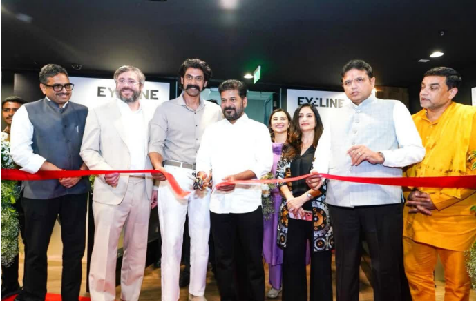
డెవలప్ మెంట్ కార్పొరేషన్ చైర్మన్ డిల్ రాజు హాజరయ్యారు. ఈ సందర్భంగా సీఎం రేవంత్ రెడ్డి ప్రసంగించారు. చిత్రరంగంలో అనేక మార్పులు తనకు సినిమాలపైన ఆసక్తి ఉందని. తన బాల్యం నుంచి ఇప్పటి వరకు చిత్రరంగంలో అనేక మార్పులు