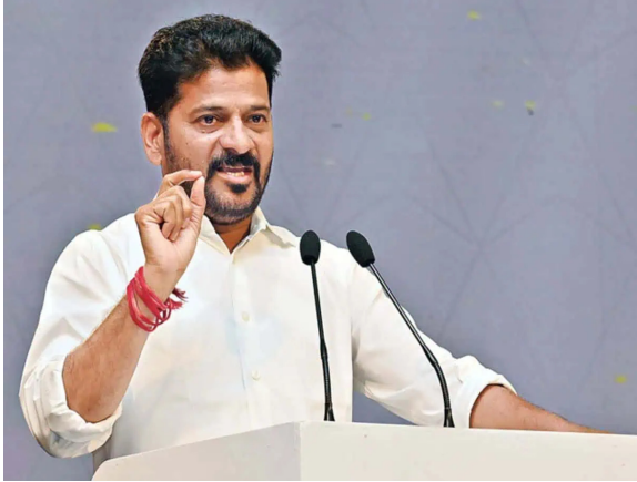
విద్యార్థుల కోసం వచ్చే అకడమిక్ ఇయర్ నుంచి ఉచితంగా లేదా 50 శాతం రాయితీతో బస్సు రవాణాను కల్పిస్తామని హామీ ఇచ్చారు. ఇలా చేయడం వల్ల దూర ప్రాంతాల నుంచి వచ్చే..

హైదరాబాద్: రాష్ట్రంలో విద్యా రంగాన్ని అగ్రగామిగా తీర్చిదిద్దడమే తమ లక్ష్యమని తెలంగాణ ముఖ్యమంత్రి రేవంత్ రెడ్డి స్పష్టం చేశారు. విద్యా శాఖను తన వద్దే ఉంచుకుని.. ప్రత్యేక శ్రద్ధతో చర్యవేక్షిస్తున్న సీఎం రేవంత్ రెడ్డి.. తెలంగాణ విద్యా రంగంలో విప్లవాత్మక మార్పులకు శ్రీకారం చుట్టే దిశగా చర్యలు చేపడుతున్నారు. హైదరాబాద్ మాదాపూర్లో నిర్వహించిన ఒక ప్రైవేట్ ఆస్పత్రి ప్రారంభోత్సవంలో మాట్లాడిన రేవంత్ రెడ్డి.. ప్రభుత్వ పాఠశాలలను మరింత బలోపేతం చేయడానికి కాంగ్రెస్ ప్రభుత్వం కట్టుబడి ఉందని తెల్పి చెప్పారు. మరీ ముఖ్యంగా నిరుపేదలకు నాణ్యమైన విద్యను అందించడమే లక్ష్యంగా కొత్త విద్యా విధానాన్ని రాష్ట్రంలో తీసుకురానున్నట్లు తెలిపారు. ఇక ప్రభుత్వ స్కూళ్లలో చదువుకునే విద్యార్థులకు త్వరలోనే ఒక శుభవార్త చెప్పనున్నట్లు సీఎం తెలిపారు. కొన్ని మారుమూల గ్రామాల్లో ఉన్న విద్యార్థులు.. ప్రభుత్వ స్కూళ్లకు వెళ్లి చదువుకునేందుకు.. కిలోమీటర్ల మేర ప్రయాణించి వెళ్తున్నారని పేర్కొన్న సీఎం రేవంత్ రెడ్డి.. వారికి రవాణా సౌకర్యం కల్పించనున్నట్లు తెలిపారు. ప్రభుత్వ పాఠశాలల్లో చదివే