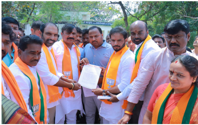
బెడ్ రూమ్ ఇళ్ల కోసం దరఖాస్తు చేసుకున్నప్పటికీ ఇప్పటివరకు ఎవరికీ ఇళ్లు కేటాయించలేదని తెలిపారు. నిర్మించిన డబుల్ బెడ్ రూమ్ ఇళ్లను వెంటనే అర్జులైన లబ్ధిదారులకు కేటాయించాలని కార్యకర్తలు పాల్గొన్నారు