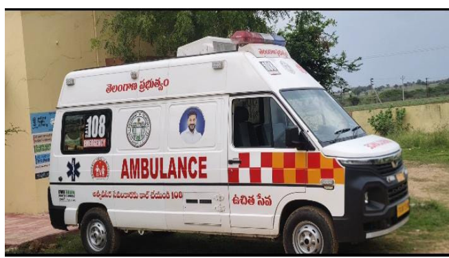
చేస్తున్నారు. ప్రాణాలు కాపాడే సేవ చేస్తున్న వారే తమ కుటుంబాలను పోషించలేని పరిస్థితికి చేరుకోవడం చర్యలు తీసుకోవాలని 108 సిబ్బంది వేడుకుంటున్నారు.

మన మహాత్మి, న్యూస్, ప్రతినధి నారాయణపేట జిల్లా: ప్రతినెల క్రమం తప్పకుండా నిధులు విడుదల చేయాలి 108 అంబులెన్స్ సిబ్బంది ఈ ప్రభుత్వం నారాయణపేట జిల్లా ప్రాణాపాయ పరిస్థితుల్లో ప్రజలప్రాణాలను కాపాడేందుకు పగలు-రాత్రి తేడా లేకుండా సేవలందిస్తున్న 108 అంబులెన్స్ సిబ్బంది ఈరోజు తమ కుటుంబాల పోషణలో తీవ్ర ఇబ్బందులు ఎదుర్కొంటున్నారు. ప్రతినెల రావాల్సిన జీతాలను సకాలంలో అందకపోవడం వల్ల వారి జీవితం కష్టాల్లో మునిగిపోయింది. ఇప్పటికే అరకొరగా వచ్చే జీతాలు కూడా సమయానికి అందకపోవడంతో ఉమ్మడి జిల్లా వ్యాప్తంగా పనిచేస్తున్న 108 సిబ్బంది తీవ్ర ఆవేదన వ్యక్తం