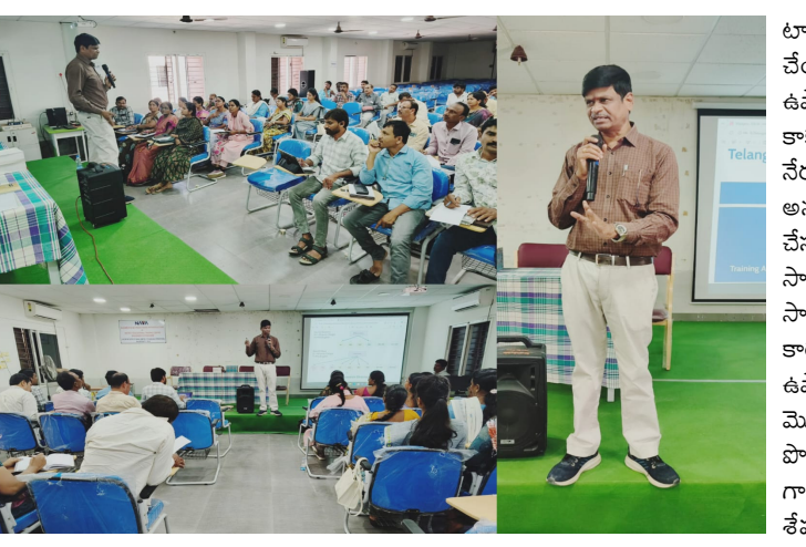
తెలిపారు. ఈ కార్యక్రమాన్ని పాఠశాలల్లో అందుబాటులో ఉన్న