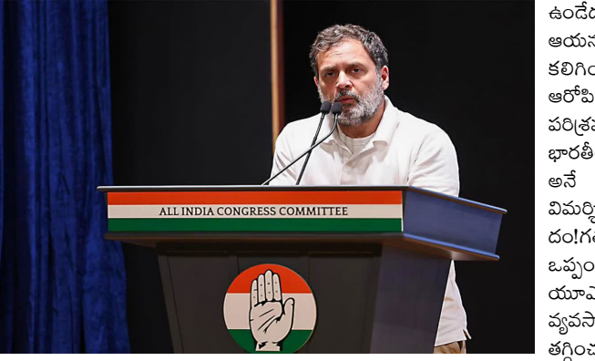
ఉండేదని రాహుల్ గాంధీ వ్యాఖ్యానించారు. మోడీ, ఆయన ప్రభుత్వం కలిసి రెండు రంగాలకు తీవ్ర నష్టం కలిగించే విధంగా ఒప్పందం కుదుర్చుకున్నారని ఆరోపించారు. ఈ ఒప్పందం కారణంగా పత్తి, వస్త్ర పరిశ్రమ రంగాలపై ఆదాంపడి ఉన్న కోట్లాది మంది భారతీయుల కుటుంబాలను నిరుద్యోగం, ఆర్థిక సంక్షోభం అనే గొయ్యిలోకి నెట్టివేశారని రాహుల్ గాంధీ విమర్శించారు. భారత్-అమెరికా మధ్య స్వేచ్ఛా వాణిజ్య ఒప్పందం కుదిరింది. అయితే, ఈ ఒప్పందంలో యూఎస్ పారిశ్రామిక వస్తువులు, విస్తృత శ్రేణి ఆహార, వ్యవసాయ ఉత్పత్తులపై సుంకాలను తొలగించడం లేదా తగ్గించడం వంటివి ఆ ఒప్పందంలో ఉన్నాయి. వీటిలో ముఖ్యంగా కోసం ఎల్లర్స్, చెల్లెల్స్, గింజలు, తాజా ప్రాసెస్ చేసిన పండ్లు, సోయాబీన్ నూనె, వైస్, స్పిరిట్స్, అదనపు ఉత్పత్తులు ఉన్నాయి. ప్రతిగా, యునైటెడ్ స్టేట్స్ పచ్చిపప్పులు, తోలు, పాదరక్షలు, ప్లాస్టిక్, రబ్బరు, సేంద్రీయ రసాయనాలు, గృహాలంకరణ, చేతివస్త్రాలు ఉత్పత్తులు వంటి ఎంపిక చేసిన భారతీయ వస్తువులపై 18 శాతం సుంకాలను వర్తింపజేయనుంది. అయితే ఒప్పందం పూర్తిగా అమెరికా వచ్చిన తర్వాత, జెనెరిక్ ఫార్మాస్యూటికల్స్, రత్నాలు, మజ్రాలు, విమాన భాగాలు వంటి వస్తువులపై అమెరికా విధించిన సుంకాలు తొలగిపోవచ్చు.

అమెరికాతో మోడీ సర్కార్ చేసుకున్న ఒప్పందం కారణంగా దేశంలో వస్త్ర పరిశ్రమ, పత్తి రైతులు తీవ్రంగా నష్టపోతారని లోక్ సభ ప్రతిపక్ష నేత రాహుల్ గాంధీ మరోసారి ఆరోపించారు. ప్రధాని, ఆయన కేబినెట్ మంత్రులు ప్రజల్లో భ్రమలు కల్పిస్తున్నారని ఆయన ఎక్కోచో దుయ్యబట్టారు. అమెరికా నుంచి పత్తిని దిగుమతి చేసుకుంటేనే, భారత వస్త్ర పరిశ్రమకు సుంకాల మినహాయింపు ఉంటుందనే విషయాన్ని ఎందుకు దాచారని ఆయన ప్రశ్నించారు. బంగ్లాదేశ్ కూడా భారత్ నుంచి పత్తి దిగుమతులను నిషేధించే సంతకాలు ఇస్తోందని, తద్వారా రైతులకు నష్టం జరుగుతుందని రాహుల్ గాంధీ ఆరోపించారు. దూరదృష్టి గల ప్రభుత్వం అయితే పత్తి రైతులు, టెక్స్టైల్ ఎగుమతిదారుల ప్రయోజనాలను కాపాడేలా ఒప్పందం చేసుకునేదని రాహుల్ అన్నారు. "భారత్ లోని టెక్స్టైల్ రంగం 5 కోట్ల కుటుంబాలకు ఉపాధినిస్తోంది. నరేంద్ర మోడీ అమెరికాతో చేసుకున్న ఒప్పందం భారత టెక్స్టైల్ రంగాన్ని అంతం చేస్తుంది. ఈ విషయం నరేంద్ర మోడీకి, మొత్తం భారతదేశానికి తెలుసు. అదే నేను పార్లమెంటులో చెప్పాను. బంగ్లాదేశ్ కు 0% పన్ను, భారత్ కు 18% పన్ను విధిస్తున్నారు. అందువల్ల భారత టెక్స్టైల్ పరిశ్రమను బంగ్లాదేశ్ టెక్స్టైల్ పరిశ్రమ దెబ్బతీస్తుంది. మనకు కూడా ఆ రాయితీ కావాలంటే అమెరికా నుంచి పత్తిని దిగుమతి చేసుకోవాలని కేంద్రమంత్రి ఒకరు చెప్పారు. కానీ అసలు నిజం ఏమిటంటే మన పత్తి బంగ్లాదేశ్ కు వెళ్తుంది. మన పత్తి ద్వారానే భారత్ లో టెక్స్టైల్ మిల్లులు నడుస్తున్నాయి.