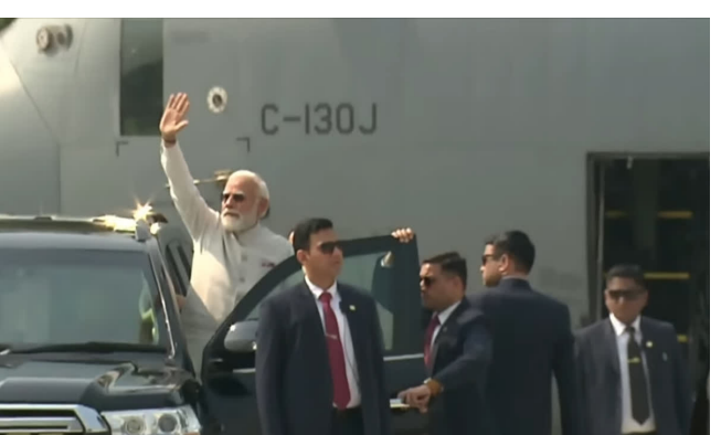
ప్రధాని మోడీ ప్రారంభించారు. ఇవి ఈశాన్య ప్రాంతంలో కనెక్టివిటీ, డిజిటల్ మౌలిక సదుపాయాలు, ఉన్న విద్యుత్ వంటి అంశాలను బలోపేతం చేసే లక్ష్యంగా ఉన్నాయి. శనివారం మధ్యహ్నం బ్రహ్మపురి నదిపై వంతెనను, ఈశాన్య ప్రాంతానికి డేటా సెంటర్ సహా అసోంలోని పలు ప్రాజెక్టులను ప్రధాని మోడీ శనివారం ప్రారంభించారు. గోవాపూర్-నుమలిపూర్ మధ్య అందర్ వాటర్ రోడ్డు, టెన్సెల్ ఏర్పాటుకు క్యాబినెట్ ఆమోదించింది. 34 కిలోమీటర్ల మేర అందర్ వాటర్ టెన్సెల్ నిర్మాణం చేపట్టాలని నిర్ణయం తీసుకుంది. ఈ టెన్సెల్ నిర్మాణంతో 250 కిలోమీటర్ల దూరం తగ్గుతుంది. ఈ టెన్సెల్ నిర్మాణం ద్వారా 6 గంటల సమయం వద్ద గమ్యస్థానాన్ని కేవలం 20 నిమిషాల్లోనే చేరుకునే అవకాశం ఉంది. బ్రహ్మపురి నది కింద రైల్వేస్టేషన్, నేషనల్ హైవే కోసం టెన్సెల్ నిర్మించనుంది. అలాగే కసారా-మన్యూడ్ మూడు, నాలుగో రైల్వేస్టేషన్ ప్రాజెక్టుకు

ఈశాన్య రాష్ట్రం అసోం చారిత్రక ఘట్టానికి సాక్షిగా నిలిచింది. అసోంలో ఏర్పాటు చేసిన తొలి ఎమర్జెన్సీ ల్యాండ్ ఇంగ్ ఫెసిలిటీను శనివారం ప్రధానమంత్రి నరేంద్ర మోడీ ప్రారంభించారు. దిబ్రూగఢ్ లోని మొరాన్ బైపాస్ వద్ద తీర్చిదిద్దిన ఎమర్జెన్సీ ల్యాండ్ ఇంగ్ ఫెసిలిటీపై సీ130జే విమానంలో మోడీ ల్యాండ్ దిగారు. తొలవడం చలువా ఎయిర్ ఫీల్డ్ కు చేరుకున్న ప్రధాని మోడీ అక్కడ సీ 130 జే విమానం ఎక్కి మొరాన్ బైపాస్ ఎమర్జెన్సీ ల్యాండ్ ఇంగ్ ఫెసిలిటీ దిగారు. అదే ఈఎల్ ఎఫ్? పై ఆరు నిక యుద్ధ విమానాలైన రఫేల్, సుఖోయ్-30, హెలికాప్టర్ విన్యాసాలను ఆయన తిలకించారు. దాదాపు 40 నిమిషాలు పాటు ఈ విన్యాసాలు జరిగాయి. అంతకుముందే ఈ ఎమర్జెన్సీ ల్యాండ్ ఇంగ్ ఫెసిలిటీ గురించి ప్రధాని మోడీ తన ఎక్స్? ఖాతాలో పోస్ట్ చేశారు. క్లిష్ట సమయంలో సహాయ కార్యకలాపాలకు, అత్యవసర ప్రతిస్పందనకు ఈ ఈఎల్ ఎఫ్ కీలకమని పేర్కొన్నారు. ఈఎల్ ఎఫ్ ప్రత్యేకత ఇదేనైనా సరిహద్దులకు సమీపంలో దేశ రక్షణకు ఈ ఈఎల్ ఎఫ్ కీలకం కానుంది. 4.2 కిలోమీటర్ల పొడవైన ఈ హైవే కోసం దాదాపు 100 కోట్లు ఖర్చు చేశారు. అత్యవసర సమయాల్లో సైనిక, పౌర విమానాల ల్యాండ్ ఇంగ్, టేకాఫ్ కోసం భారత వైమానిక దళం(ఐఎఫ్ఎఫ్) సమస్యలతో ఈ ఈఎల్ ఎఫ్?ను ప్రత్యేకంగా అభివృద్ధి చేశారు. దీని వల్ల సరిహద్దు ప్రాంతాల్లో ఉద్రిక్తతలు జరిగినప్పుడు భారత వాయుసేన వేగంగా స్పందించేందుకు అవకాశం ఉంటుంది. 40 టన్నుల వరకు యుద్ధ విమానాలను, 74 టన్నుల గరిష్ట బెరుకట్? బయటపెట్టే గల రవాణా విమానాలను నిర్వహించగలదు. టేకాఫ్, ల్యాండ్ ఇంగ్?కు అనుకూలంగా దీనిని రూపొందించారు. ఇప్పటికే పశ్చిమ, ఉత్తర, మధ్య భారత్ లో ఈ ఈఎల్ ఎఫ్ లు ఉన్నాయి. రూ. 5,450 కోట్లకు పైగా విలువైన అభివృద్ధి ప్రాజెక్టులను కూడా