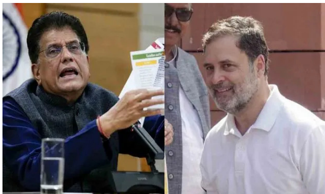
అమాయకపు రైతులను తప్పు దోపిడీ పట్టించేందుకు రాహుల్ గాంధీ, ఆయన స్నేహితులు ఇలాంటి నకిలీ సమావేశాలు నిర్వహిస్తున్నారు. వీరి నిజ స్వరూపాన్ని బయటపెడతాను' అని ప్రవేశిస్తాయని రాహుల్ వారికి చెప్పారని కాంగ్రెస్ ఓ ప్రకటనలో వెల్లడించింది.

ఢిల్లీ, ఫిబ్రవరి 14: (శుక్రవారం) లోక్ సభ ఆవరణలో రైతు సంఘాల నేతలతో కాంగ్రెస్ అగ్ర నేత, ప్రతిపక్ష నాయకుడు రాహుల్ గాంధీ సమావేశమైన సంగతి తెలిసిందే. పార్లమెంట్ భవన సముదాయంలో జరిగిన ఈ భేటీలో భారత్-అమెరికా వాణిజ్య ఒప్పందం, రైతులు, రైతు కూలీల జీవనోపాధిని కాపాడడంపై చర్చ జరిగింది. ఈ సందర్భంలో రైతులతో రాహుల్ భేటీ.. నకిలీ సమావేశం అంటూ బిజెపీ నేతలు విమర్శించారు. రాహుల్ నిర్వహించిన మీటింగ్ కృత్రిమమైందని, అలానే ఆధారం లేనిదంటూ బిజెపీ నేతలు మండిపడుతున్నారు. శనివారం 'ఎక్స్' వేదికగా కేంద్ర మంత్రి పియూష్ గౌయల్ వీడియోను రిలీజ్ చేశారు. 'రాహుల్ గాంధీ మరోసారి రంగస్థలం నిర్వహించారు. ఆయన నిర్వహించిన సమావేశం అత్యంత కృత్రిమమైందనిగా ఉంది. అలాగే దీని ద్వారా నకిలీ కథనాన్ని బయటపెట్టారు. ఈ సమావేశంలో కాంగ్రెస్ నేతలు రైతులలా నటించారు. వారితో రాహుల్ గాంధీ నకిలీ సంభాషణ నిర్వహించారు. రైతుల ప్రయోజనాలను ప్రధాని మోడీ పూర్తిగా రక్షించినా కూడా..